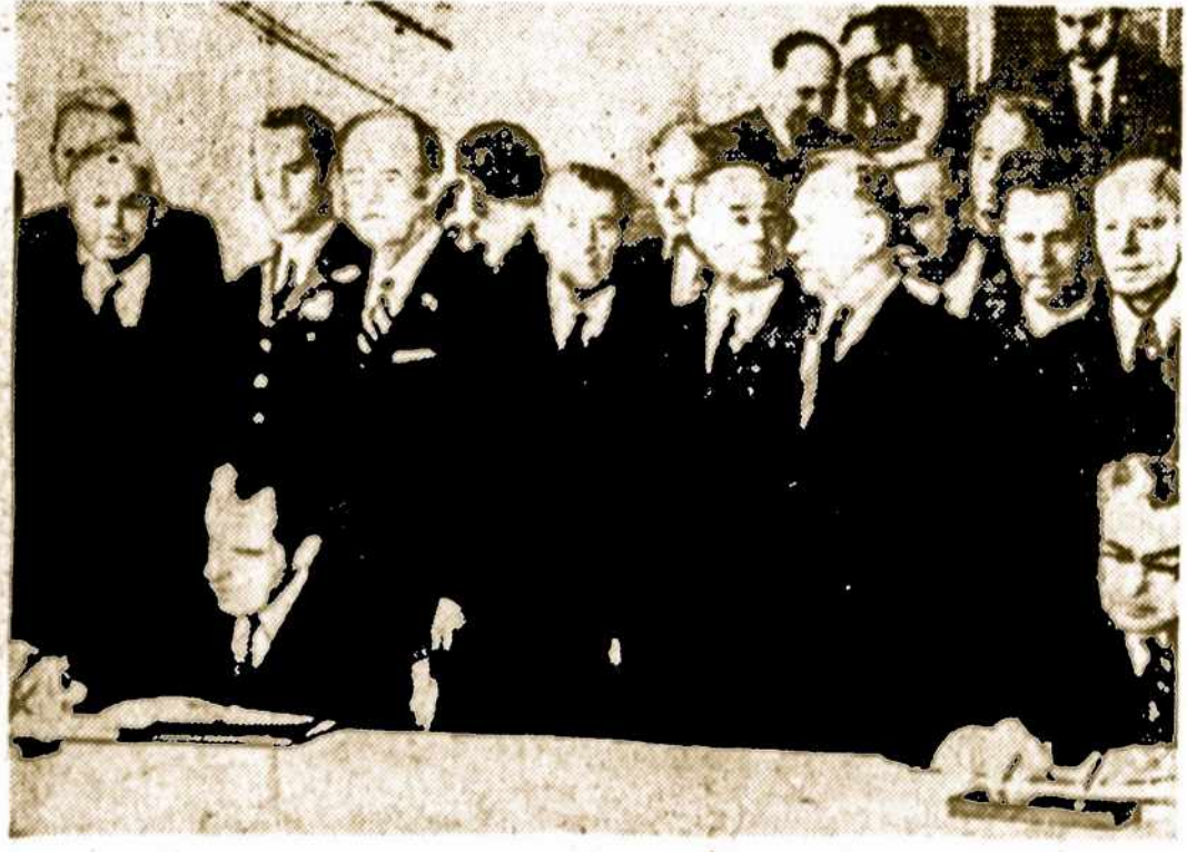
JAV prezidentas Richard Nixon (kairėje) ir TSRS premjeras Leonid Brežnev, 26. 5. 72, Kremliuje pasirašo branduolinių ginklų sumažinimo sutartį, "užtikrindami dabartines valstybių sienas ir taiką".

— Kubos premjeras Fidel Castro 8 dienas viešėjo Bulgarijoje.