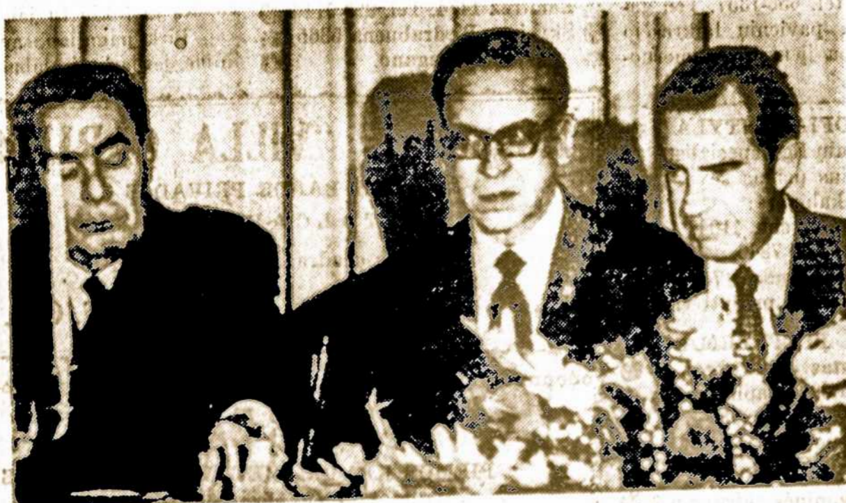
Banketas puošniausioje Kremliaus salėje. Tarpe JAV prezidento Nixono ir TSRS Kompartijos viršininko Brežnevo matosi Kremliaus vertėjas, Draugiško mis sutartinis ir banketas bent laikinai pasiekta taikaus bendradarbiavimo, bet palaidotos pavergtųjų išsilaisvinimo viltys. Vieni kritikuoja taikos apė tatus, bet kiti juos sveikina.