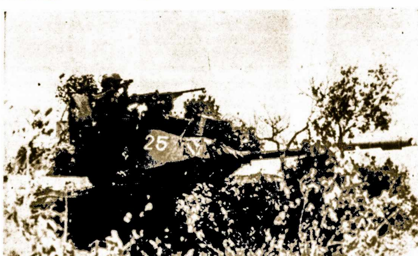
Tebevyksta aršios kovos tarpe Pietų ir šiaurės Vietnamo. Paryžiaus pasitarimai ir Nixono patarėjai karą nori baigti.

— Urugvajaus prezidentas Bordaberry organizuoja naują kabinetą, jo vyriausybei atsistatydinus.