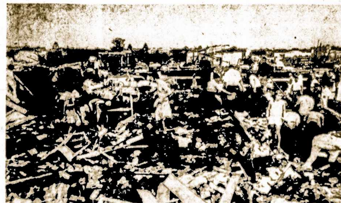
San Justo miestelio griuvėsinose, Santa Fe provincijoje, audrai nurimns, gyvi likę gyventojai, ieško savo vertingusių dalykų; likusių griuvėsinose.

Av. Azopardo y 25 de Mayo — Longchamps. Seniausia lietuvio vadovaujama laidojimo įstaiga.