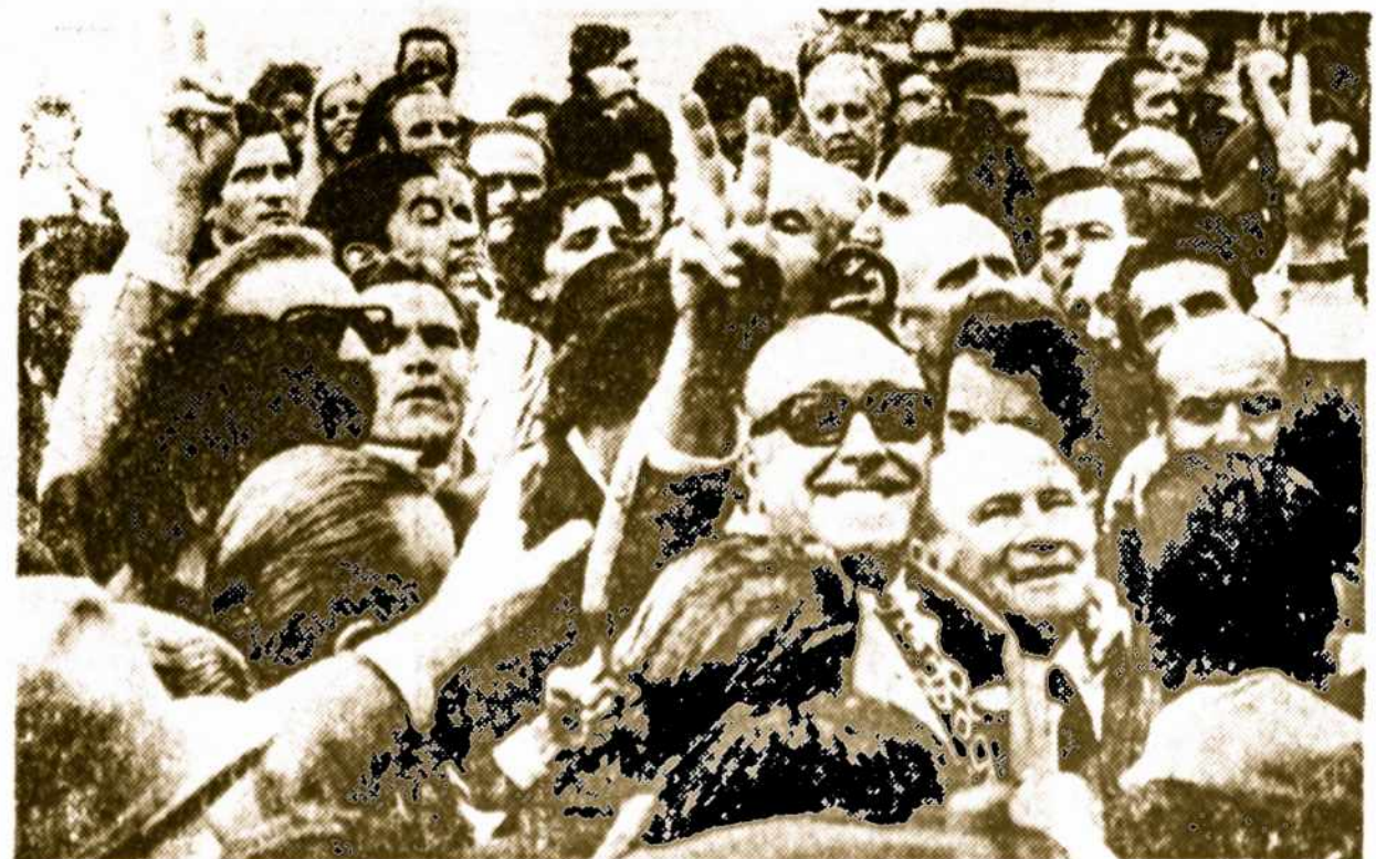
Buenos Aires aeodrome Ezeiza 1. 4. 73 entuziastiški šalininkai sutinka iš Europos grįžusį dr. H. Campora, kuris 25. 5. 73 pradės eiti Respublikos prezidento pareigas.

New Yorko "Journal of Commerce" 20. 3. 73 skelbia, kad ekonominė Argentinos padėtis šiemet pagerėjo, didelio derliaus dėka. Vienok manoma, kad naujasis prezidentas dr. Campora bus priverstas nuvertinti pezo kursą bent 30%.