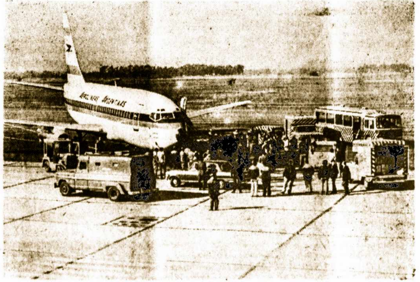
Kelionėje užpuoliko pasigrombtam Argentinos lėktuvui iš Kubos grįžus į Ezeiza praėjusią savaitę, šarvuotas banko autas laukia iškraunant 700 milijonų pesų, pavežiotų kitos krypties keliais.

— Suomijos sostinėje, Helsinky, febevyksta Europos saugumo konferencija. Didieji ieško priemonių karams išvengti.