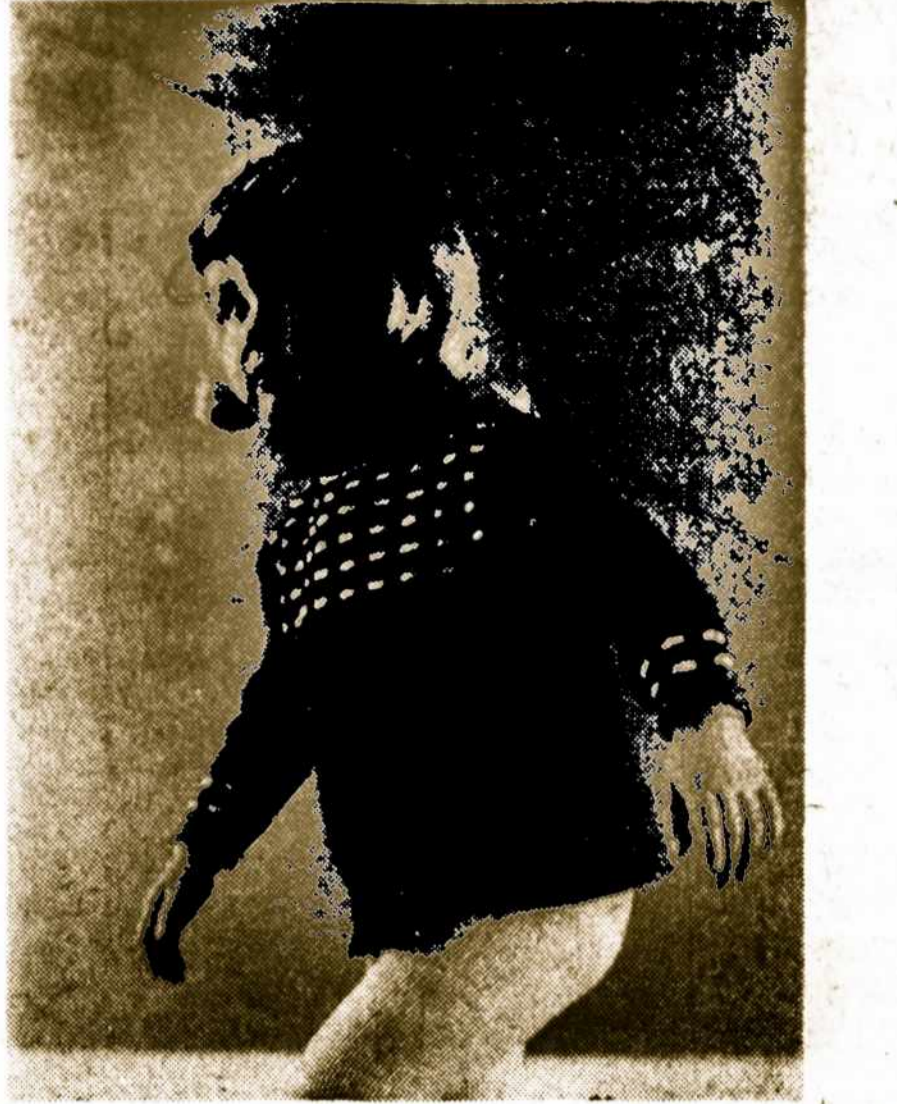
Vaiko Diena A. L. Centre įvyks sekmadienį, 5. 8. 73, 16 val. Visi skubėkime su savo tėveliais!

Plunksna yra galingesnė už kardą. — Lytton.