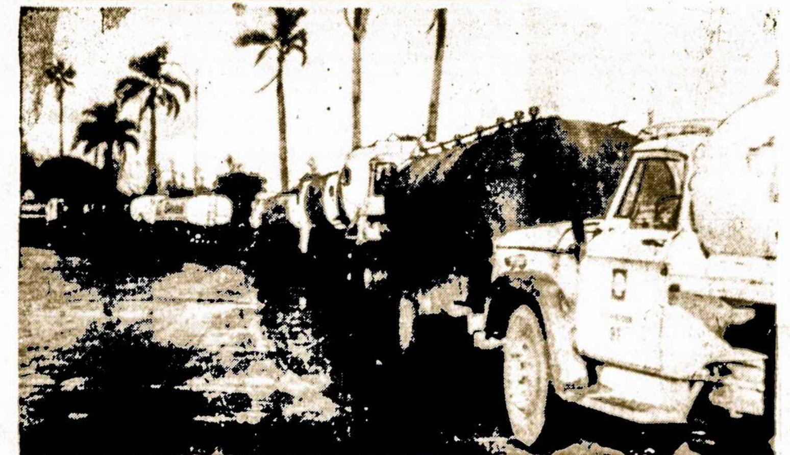
Ilgiausias autų-sunkvežiminių eilės Urugvajaus sostinėje, Montevideo, laukia progos dastatyti gyventojams kūrą. Dėl vykstančių neramumų leidžiama aptarnauti tik ligonines ir kitas visuomenines įstaigas.