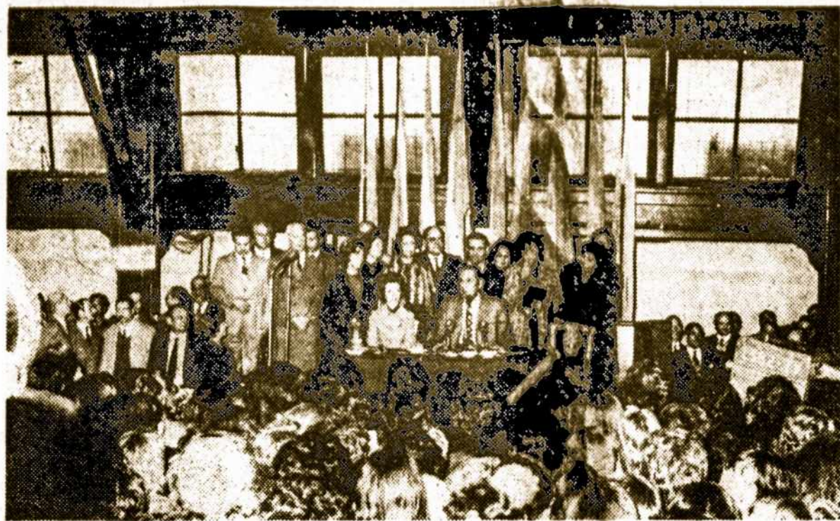
3.000 moterų atėjo prezidentūron i Olivos 13. 8. 73. Joms kalba gen. J. D. Peron, prie jo sėdi žmona Isabel Martinez. Peronas pasakė, kad Italijos žemės plotas sudaro tik penktadalį Argentinos, bet ten išgyvena 58 milijonai gyventojų. Kinija su 800 milijonų gyventojų neseniai badavo ir ten badu mirdavo nuo 10 iki 15 milijonų žmonių kas met, o dabar eksportuoja maistą.