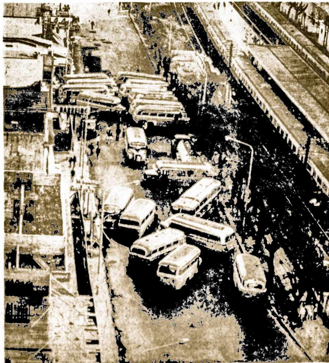
Taip 13. 8. 73 atrodė septintasis kelias prie Ramos Mejia, kuomet jį užblokavo streikuojanči kolektyvių šoferiai.