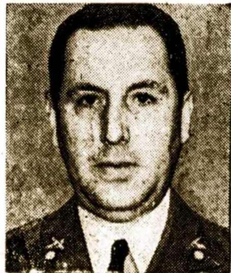
Gen. JUAN DOMINGO PERON, peronistinio justicialistų bloko FREJULI kandidatas į Respublikos prezidentus 23. 9. 1973 įvykstantiuose rinkimuose. Kandidatė ir viceprezidentus paskirta jo žmona Isabel Martinez de Peron.