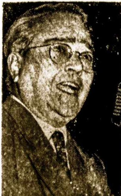
Dr. RICARDO BALBIN, Unien Civica Radical partijos kandidatas į Argentinos Respublikos prezidentus. Į vice — radikalų prezidentas Fernando De la Rúa. Prezidento ir viceprezidento rinkimai įvyks rugsėjo 23, 1973.