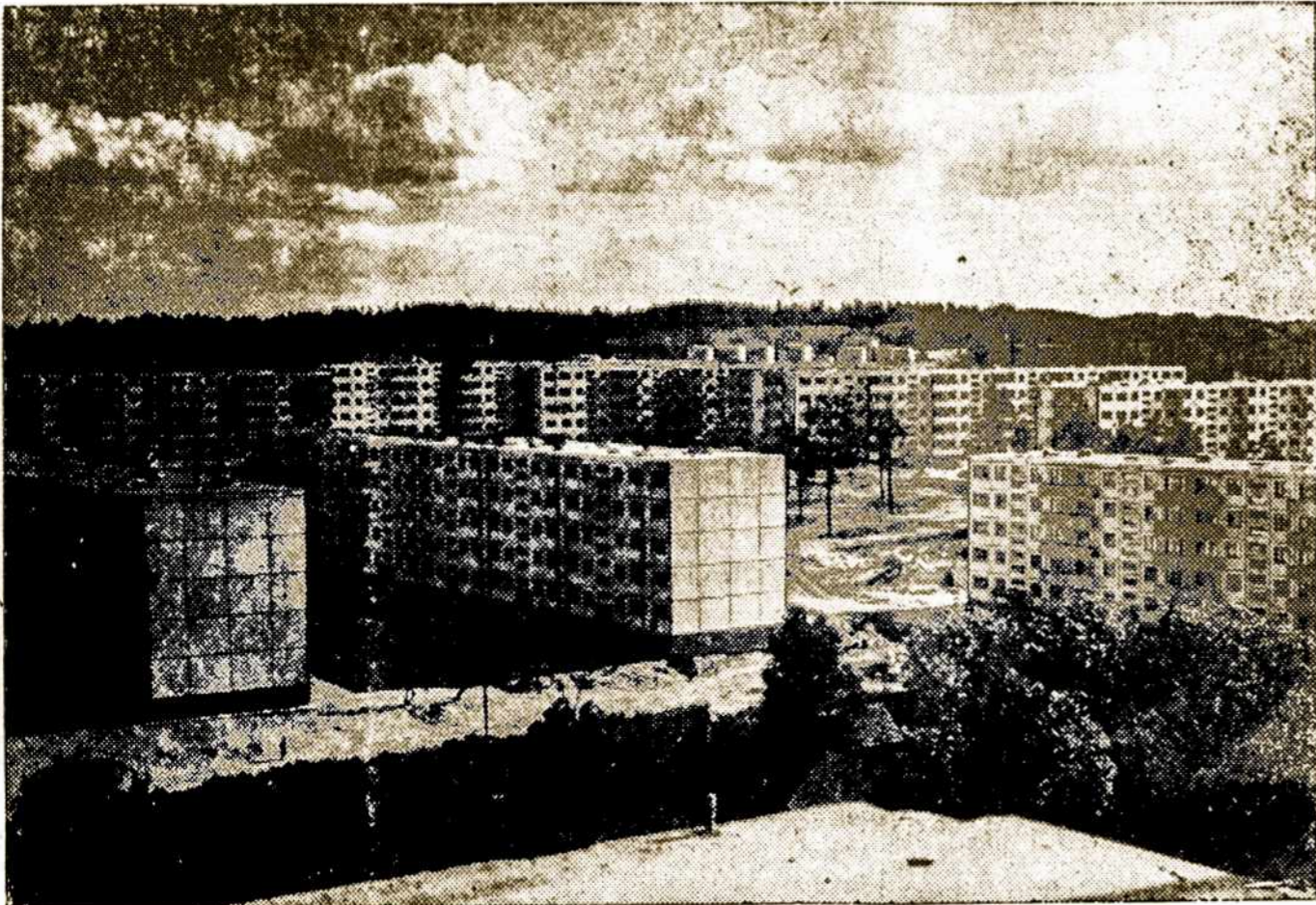
Vilniaus priemiesčio vaizdas.

riniuose dokumentuose Vilnius mi- nimas 1323 m., kurie ir laikomi miesto įkūrimo data.