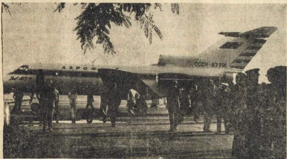
Tarybinis "oro autobusas" JAK-40, skraidantis Lietuvos padangėje. Šio tipo lėktuvus buvo parodytas Argentinos karo ir civilinės aviacijos parodoje Buenos Aires Aeroparke 6. 3. 1972. Jo nuotrauka tilpo A. L. Balso Nr. 1411 (16. 3. 1972). Kelionė iš Vilniaus į Palangą trunka tik 40 minučių.