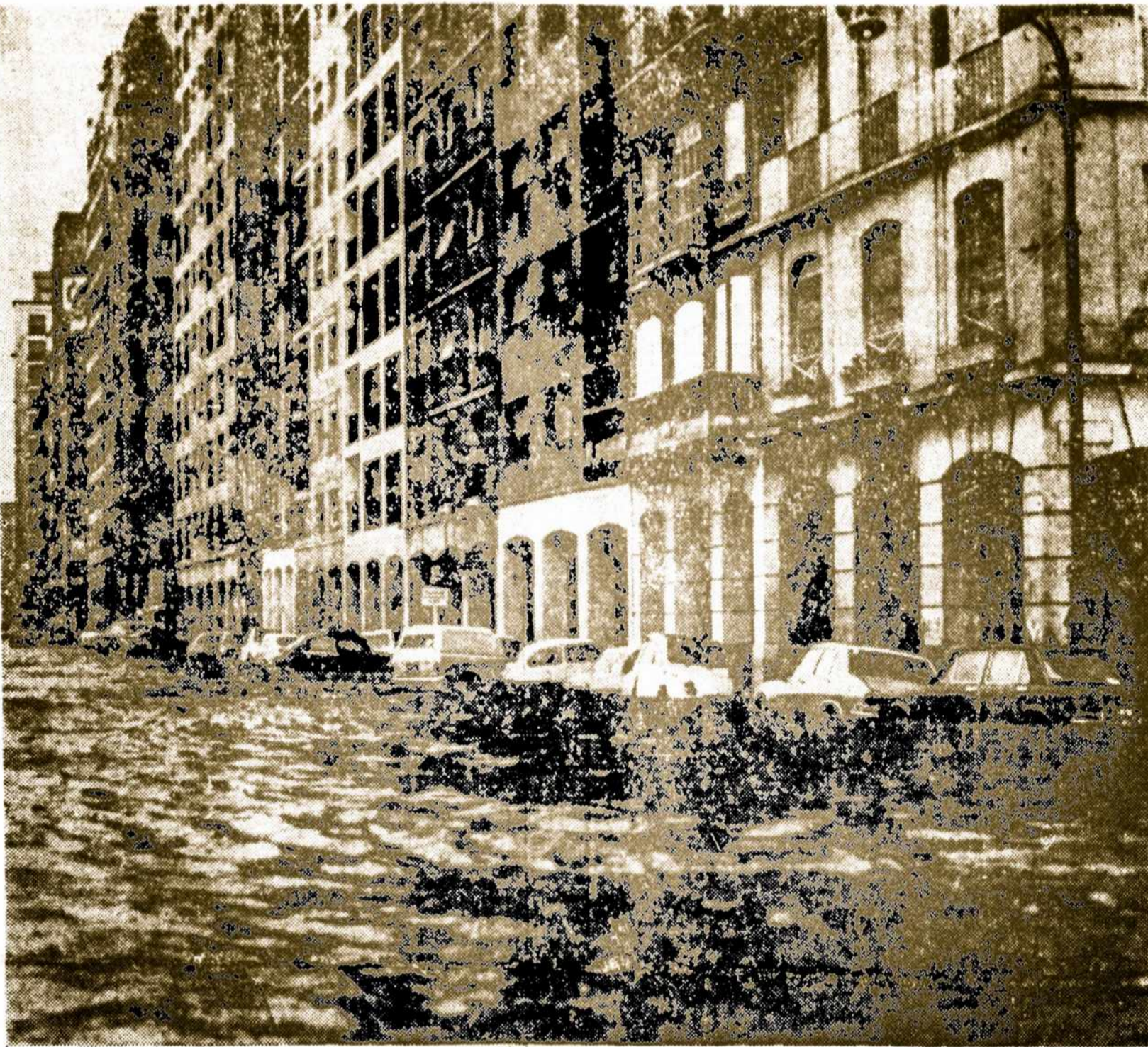
Paveiksle matosi kokia gausybė vandens buvo Buenos Aires miesto gatvėse per didžiosius lietus.