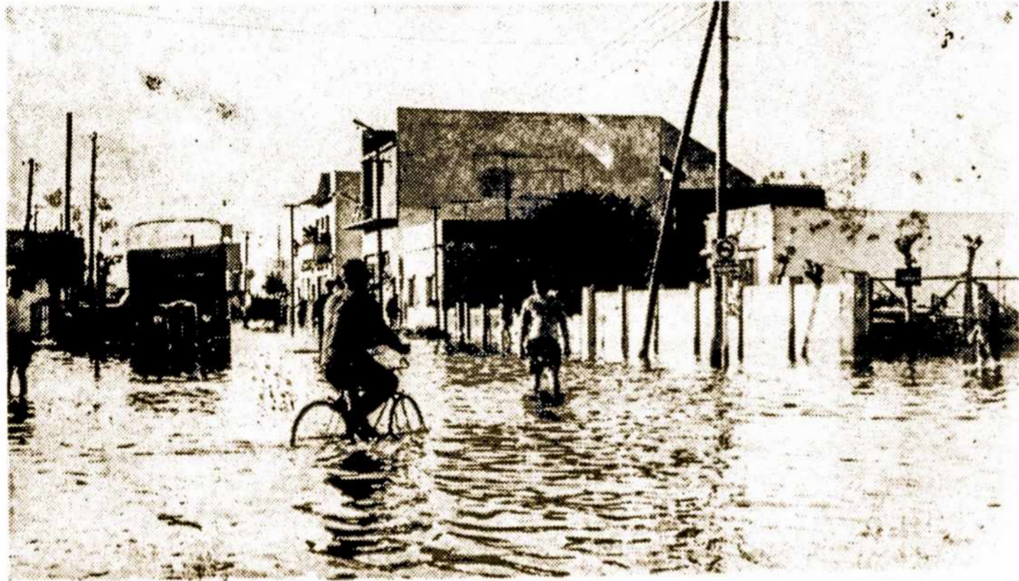
Paveiksle matosi kokia gausybė vandens buvo Santiago miesto gatvėse per didžiosius lietūs.

Parduoda urmo kainomis krautuvėms ir pavieniai.