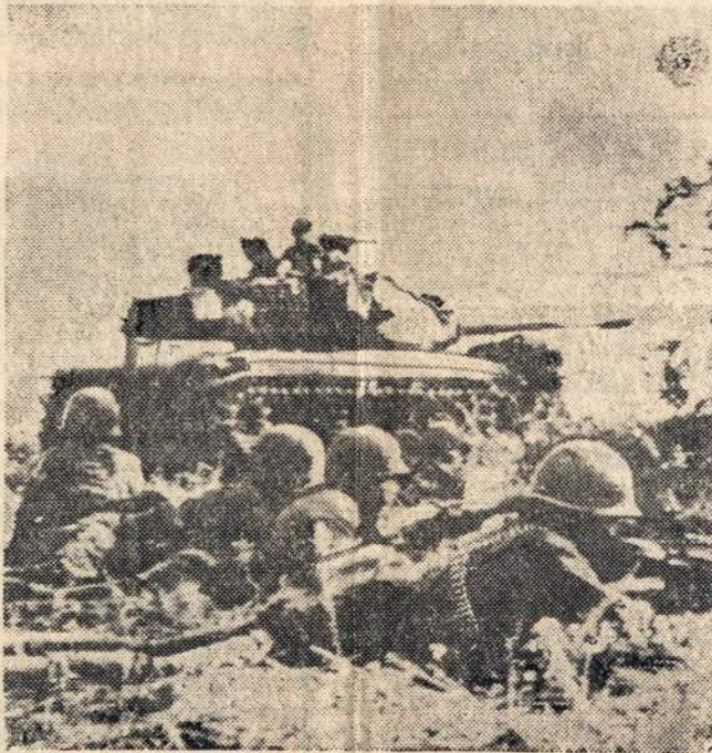
Prie kanalo Suez šiaip taip lipdosi taika tarp egiptiečių ir izraelitų, bet Golano srityje eina kovos tarp sirijiečių ir izraelitų, dėl kurių trukdomas petrolio pristatymas Vakarams.

Gydytojų pareiškime sakoma, kad amerikiečiams, gydytojų pacientams bus geriau pasitarnauta, jei kongresas atšauks svo priimtą įstatymą ar jį taip pakeis, kad nebūtų jokių gydytojų tikrinimų ir nebūtų jokių profesijos standartų, kurių visi turėtų laikytis. Miñėtas įstatymas turėtų įsigalioti tik 1976 metais, tačiau gydytojai jau dabar jį pasmerkė.