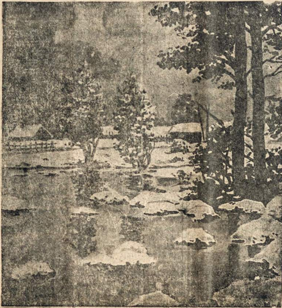
Argentinoje kovo 21 baigėsi Vasara, tuo pat laiku Lietuvoje prasideda Pavasaris. Jono Pogoreckio piešinyje — pirmas sniegas, kuris šiuo laiku palieka Lietuvos žemę užleisdamas vietą įvairiaspalvei augmenijai.