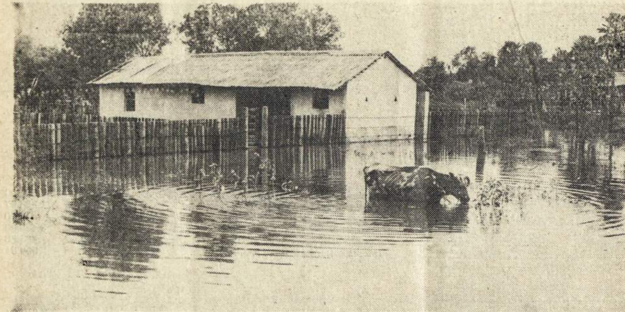
Argentinos provincijos—Santiago del Estero, Juju y, Tucuman ir Chaco— kurioms vanduo būvo pristatomas traukiniais, šią vasarą paskendo. Netik pasėliai sunaikinti bet ir trobesiai rimtai nukentėjo. Galvi jai išdvėse.

COCHERIA "FERNANDEZ" FERNANDEZ & TIMINSKAS, sav. Telefono: 243 — 5654 Casa central: Av. H. Irigoyen 11070, Turdera SERVICIO DE CALIDAD — AMBULANCIAS — SEPELIOS — CASAMIENTOS Seniausia lietuvių vadovaujama įstaiga.