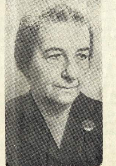
MINISTERĖ GOLDA MEIR