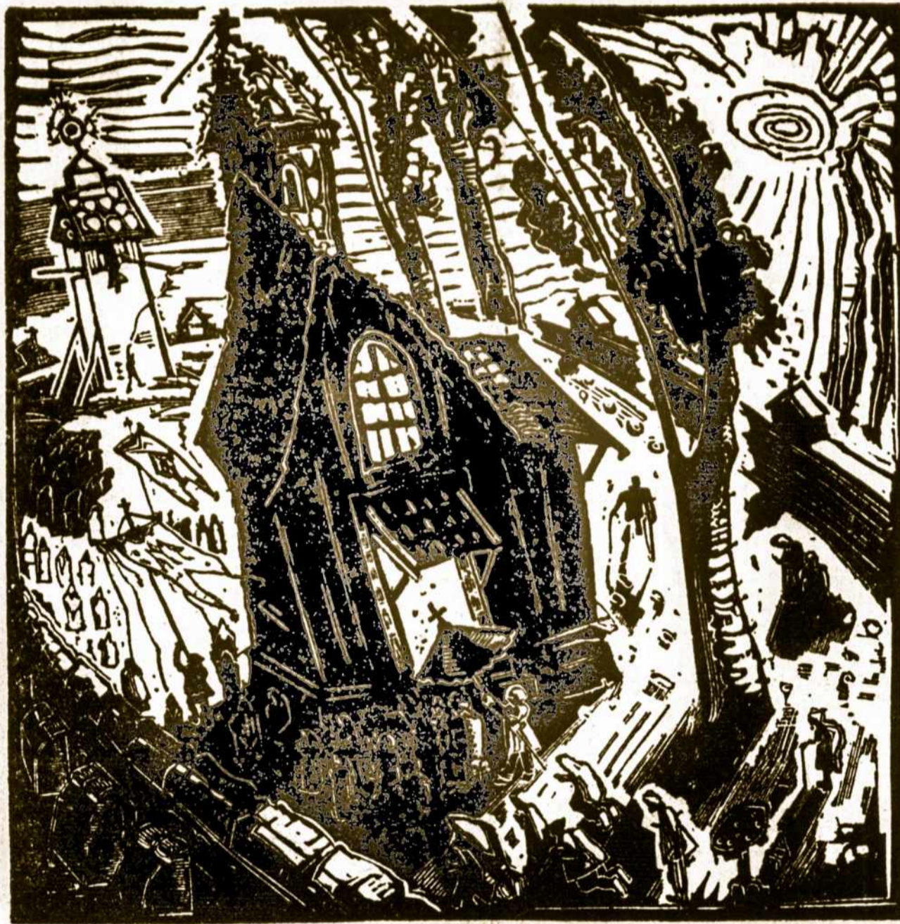
Velykų rytas - Lietuvoje.