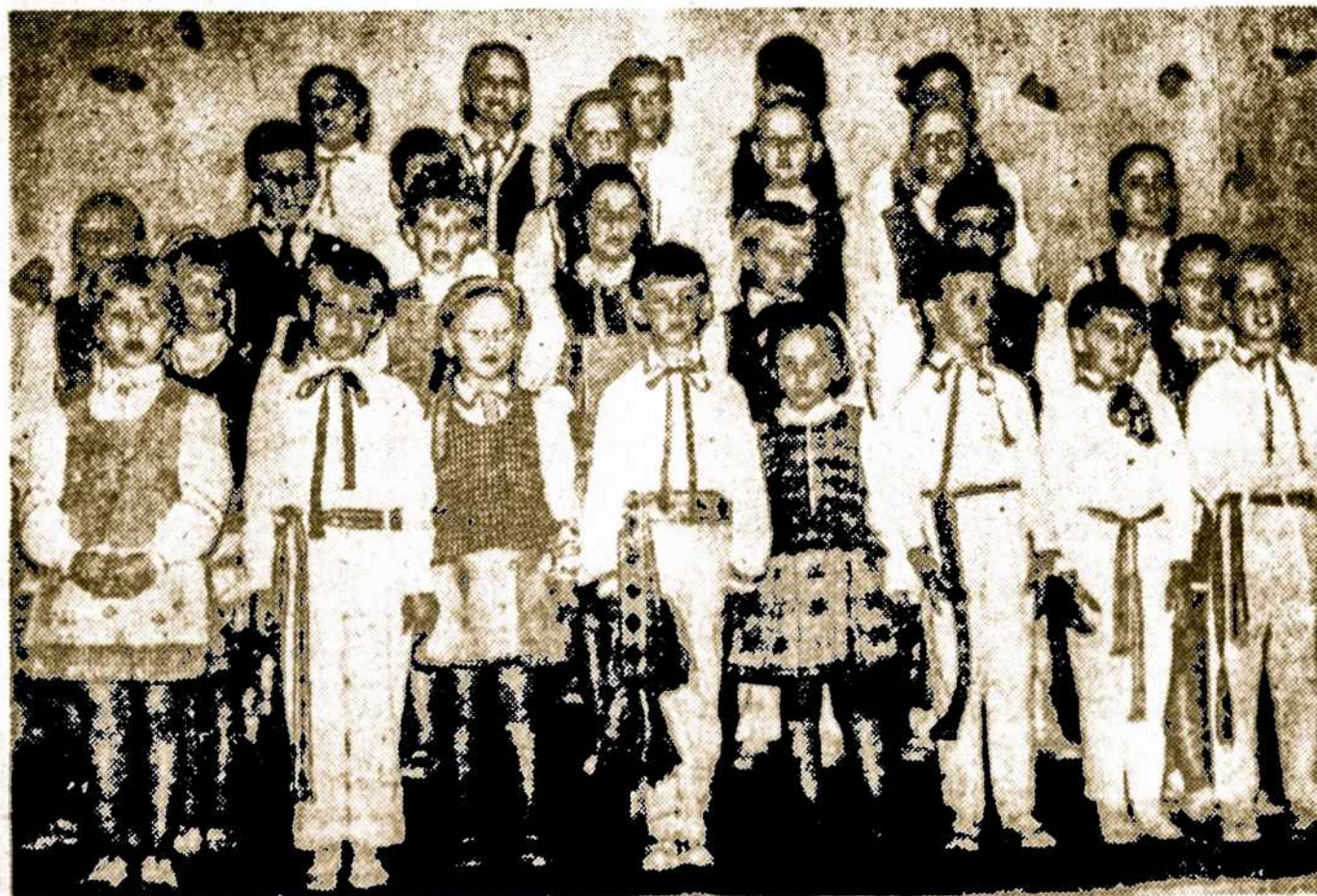
Šie vyrai kaip pipirai ir mergytės kaip rožytės buvo kuomet pradėjo lankyti S. L. Arg. mažųjų ansamblių ir lietuvių kalbos pamokas. Nuo šio balandžio 20 jau kita pamaina lanko S. L. Arg. V. Kudirkos rūmuose vykstančias lietuvių kalbos pamokas ir repetuoja šokius.