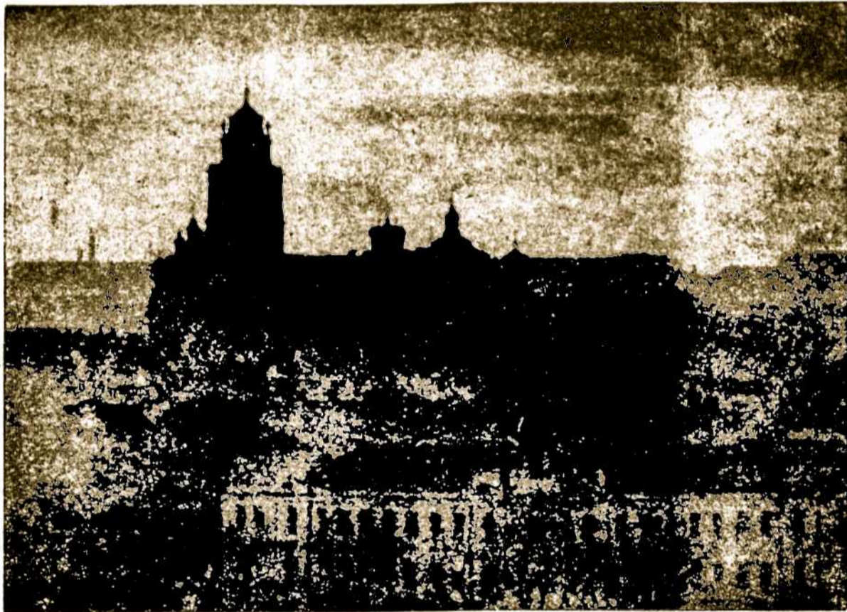
Vilniuje yra 39 bažnyčios. Dauguma iš jų dabar neveikiančios. Paveiksle — šv. Jono vardo bažnyčia.

■ STALIŲ MAŠINOS parduodamos pigiai. Kreiptis pirmadieniais visą dieną: Asunción 41, Villa Sastre, TEMPERLEY.