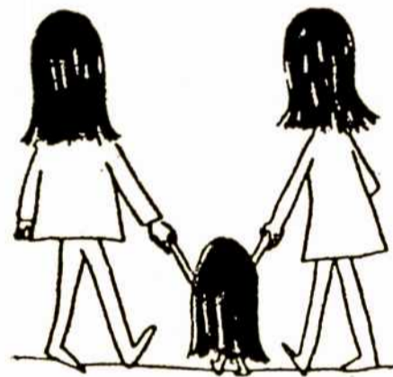
Tėvelis, mamytė ir dukrytė — išėjo pasivaikščioti. Atspėkite, kuris iš jų tėvelis?