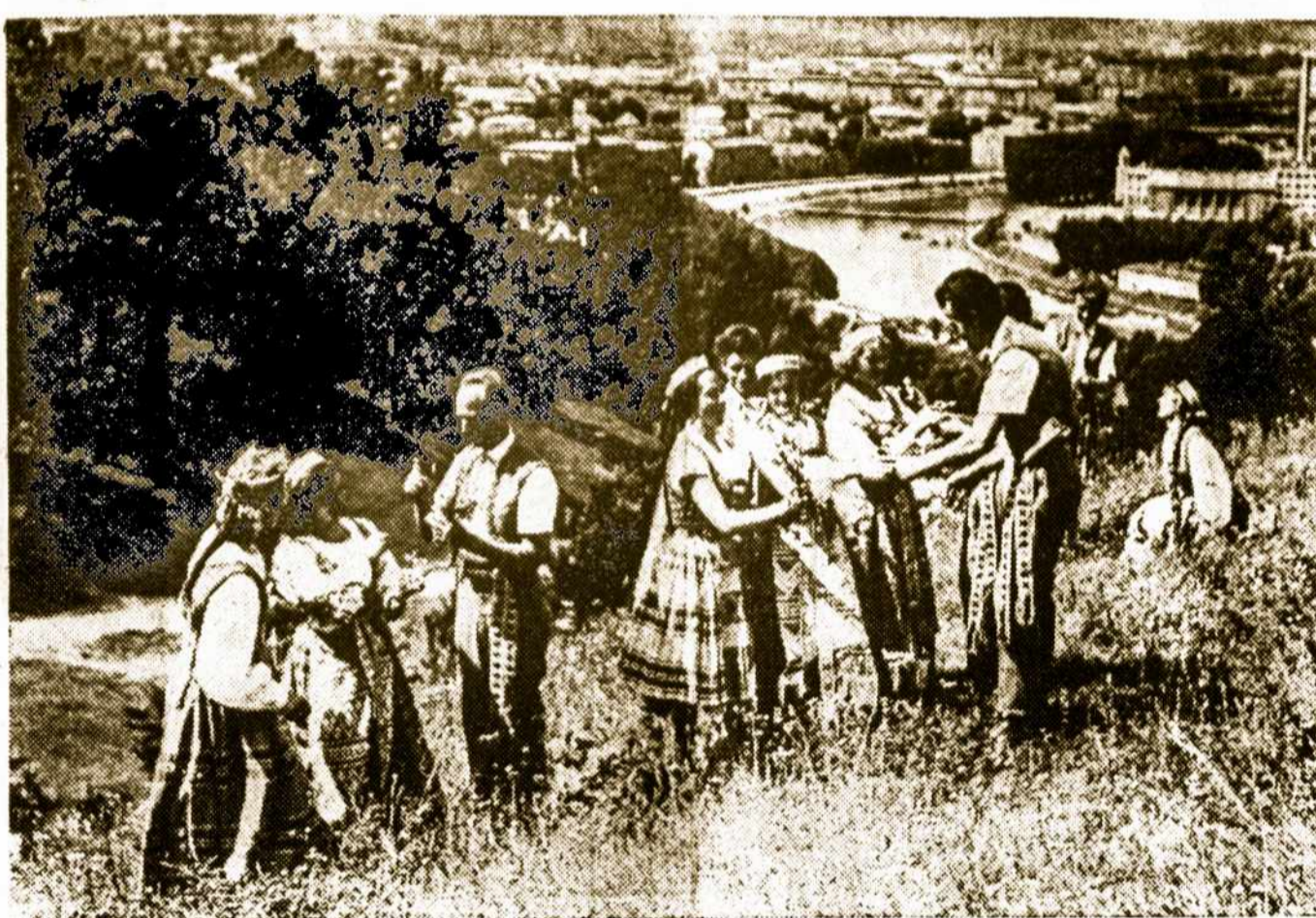
Pats gražiausias laikas Lietuvoje Birželio mėnuo, kurio gale prasideda Vasara. Lietuvos jaunimas labai mėgsta gamtą. Per vasarą vyksta visokios iškylos į gamtą: ekskursijos, gegužinės ir tt.