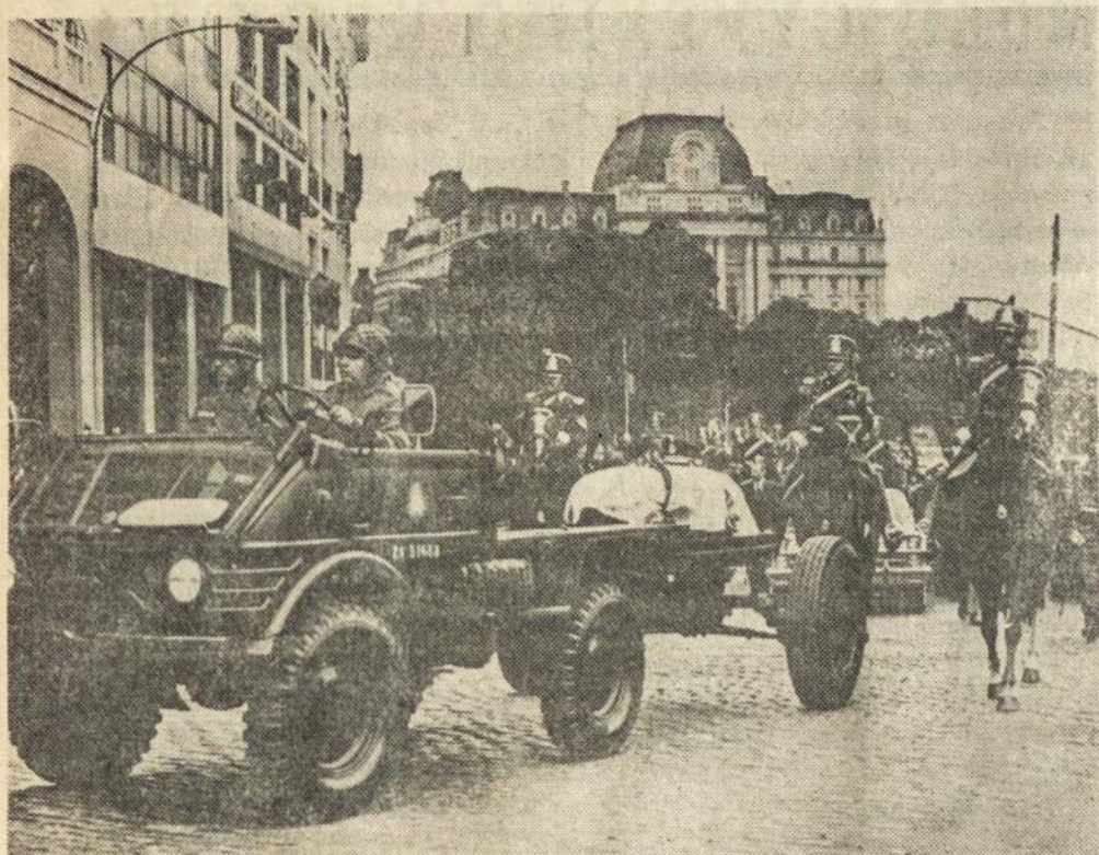
Kariškas vežimas-cureña gabenantis buv. Prezidento palaikus į Katedra, vėliau į Kongreso rūmus kur tukstančių tukstančiai žmonių dvi dienas ir dvi naktys praėjo pro karstą kad pasakyti paskutinį sudieu.