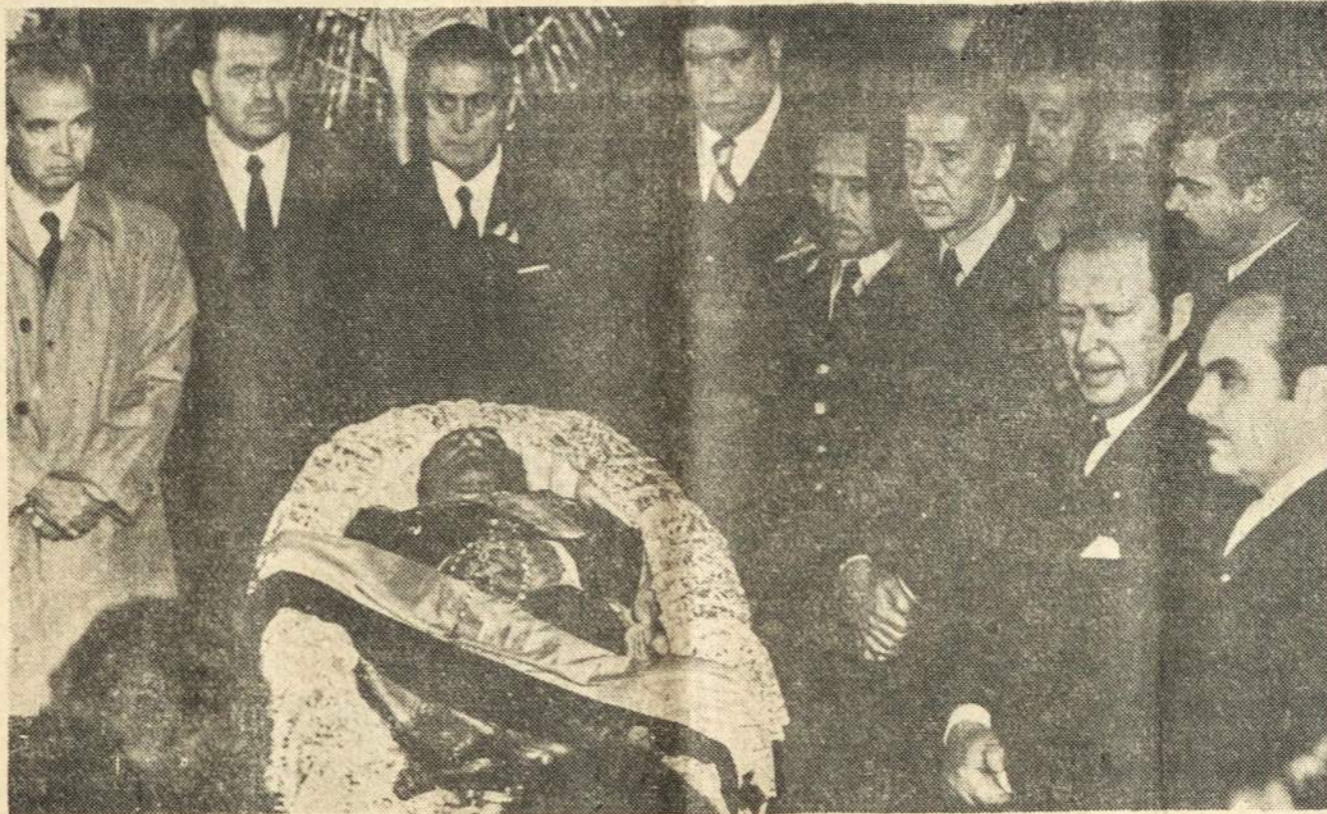
Didžiausias mirusio Argentinos Prezidento gen. J. D. Perono draugas Paragvajaus ilgametis prezidentas, gen. Alfredo Stroessner, atvykęs su 25 asmenų delegacija, matomas antras iš kairės, prie mirusiojo karsto Kongrese. Laidotuvėse, kuriuos tęsiasi tris dienas. Dalyvavo dar Urugvajaus ir Bolivijos prezidentai. Taipgi daugybė kitų valstybių delegacijų ir šimtai tukstančių argentinų gyventojų.