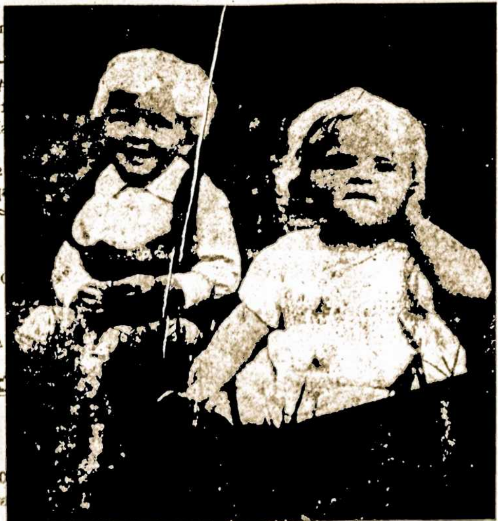
Vieni vaikai laukia rugpjūčio 4 dienos. Ta diena įvyks A. L. Centre jau kelinti metai iš eilės VAIKŲ DIENA su įdomia programa vaikams. Mamytė butinai atveskit savo mažylis rugpjūčio - agosto 4, 1974, 18 valandą.

Alyvą perkančios valstybės badą kenčiantiems jau davė šimtus tūkstančių dolerių, o alyvą parduodančios — nieko arba tiek mažai, kad jų pašalpa tesudaro tik 1% kitų suteiktos pagalbos.