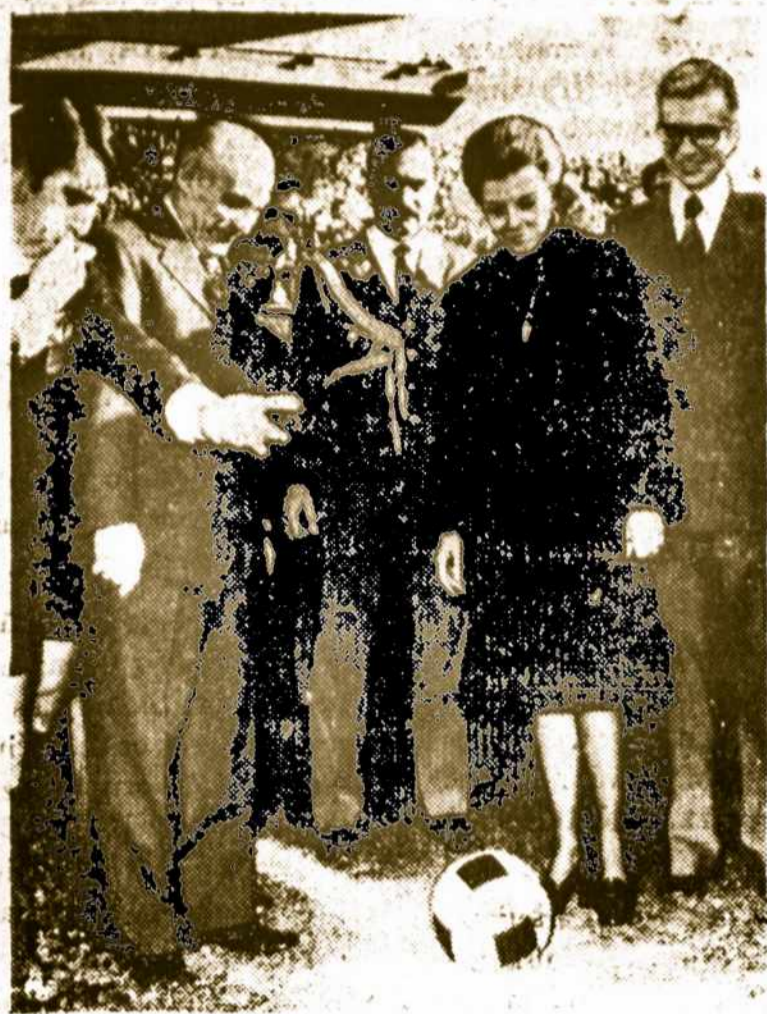
Argentinos Prezidentas M. E. Martínez de Perón pradeda, Jaunimo futbolo varžybas pavadintas "Evita" ir "Naujas žmogus 74". Žaidinys prasidėjo 9. 8. 74 visoje Argentinoje įjungdamas tukstančius jaunimo.