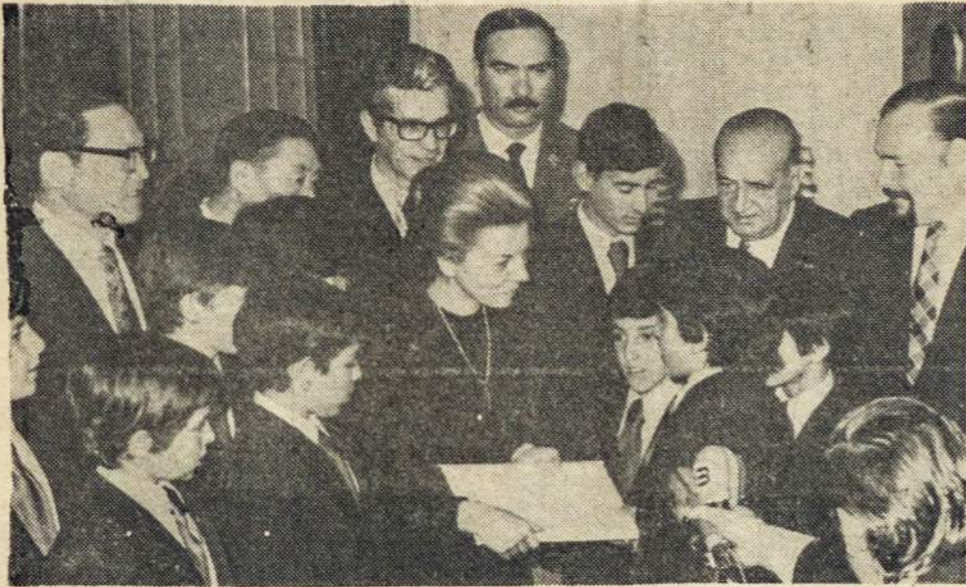
Argentinos prezidentas María Estela Martínez de Perón tarpe moksleivių, kurie nuolat aplanko prezidento rezidenciją, Olivos mieste.