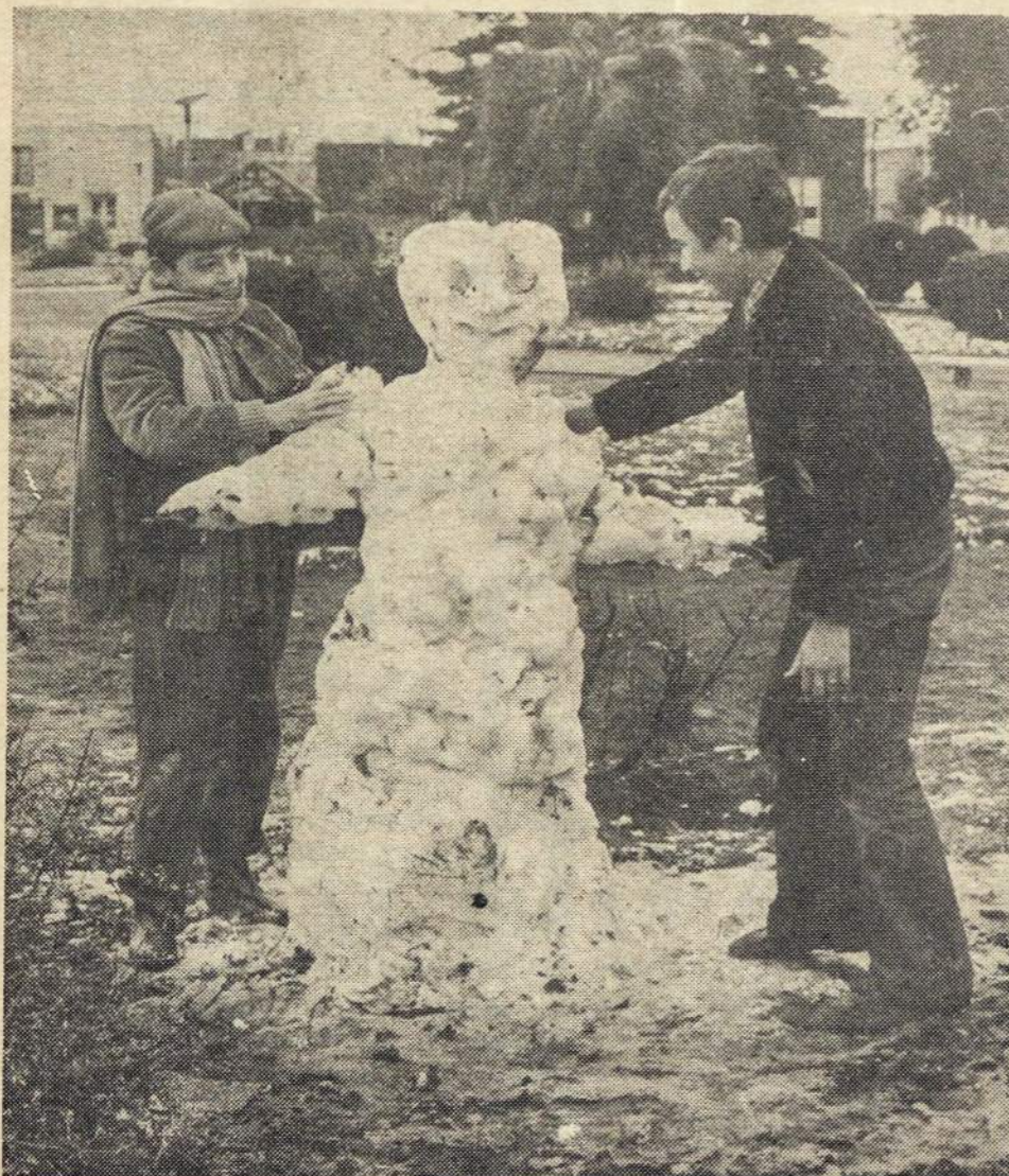
Ir šiemet Argentinos vaikai galėjo lipdyti iš sniego senius besmegenius.