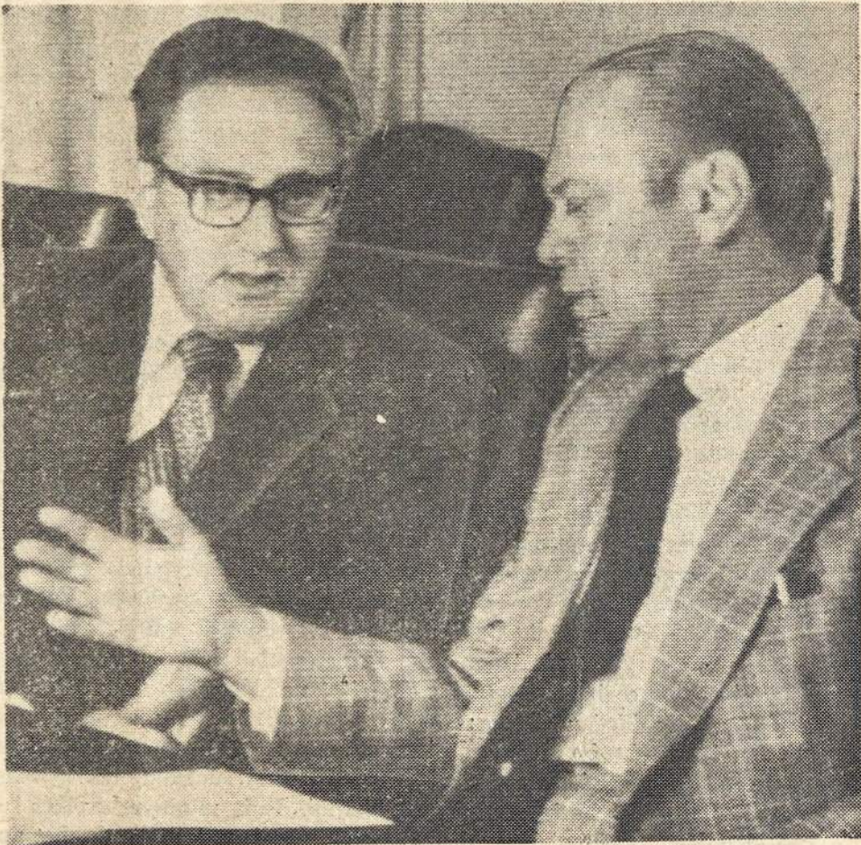
JAV prezidentas Gerald Ford, dešinėje, kuris 8. 9. 74 paskelbė visų prasiškaltimų dovanojimą buv. prezid. R. Nixonui, tariasi su JAV užsienio reikalų ministru Henry Kissingeriu, kuris kaltinamas kaip vienas iš svarbių kaltininkų Čilės prezidento nuvertime. Washington Post ir The New York Time skelbia didelį visuomenės nepasitenkinimą tokių vieno ir kito aukštų valdininkų elgesiu.

Sovietų Sąjungoje nėra statistikos apie narkotikų naudojimą, tačiau spaudoje vis dažniau pasirodo užuominų apie šią jaunimo rykštę. Alkoholis sovietinėje visuomenėje labai paplitęs ir laikomas sunkia socialine problema, tačiau paskutiniiais metais, ypačingai didesnių miestų jaunimo tarpe, ėmė populiarėti ir kanapių rūkymas.