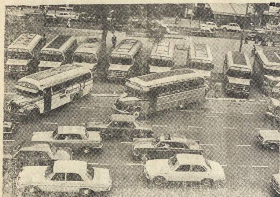
Lapkričio pabaigoje Buenos Aires miesto transportistai buvo sustraiikave.