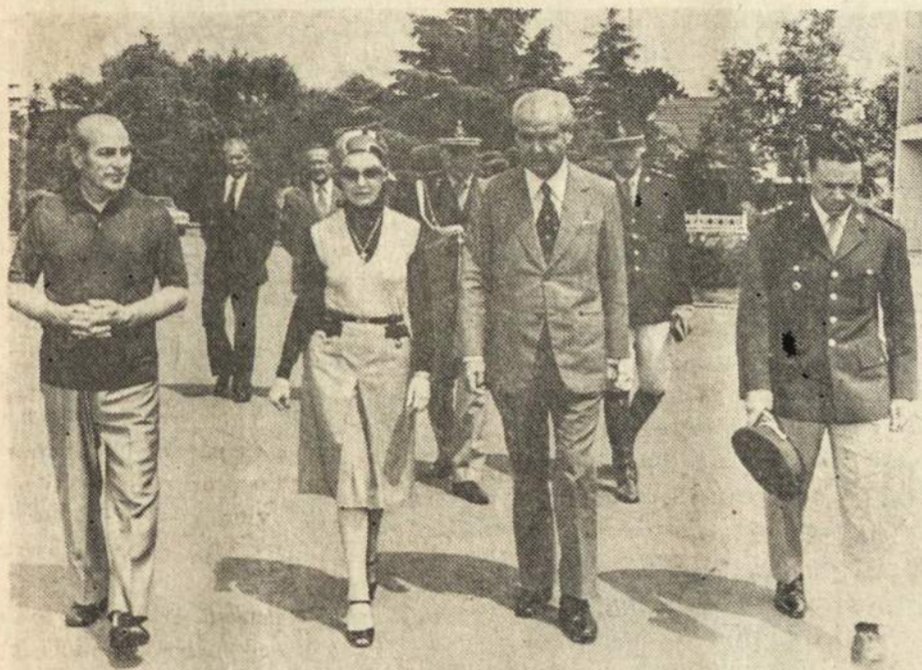
Argentinos prezidentė M. E. M. de Peron poilsiauja prie Atlanto, Chapadmalal vietovėje. Jos draugystėje aukšti valstybės pareigūnai.