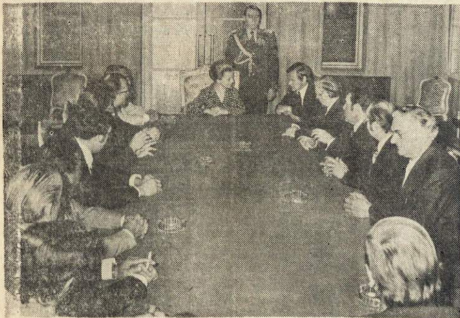
Gruodžio pradžioje Argentinoje lankėsi Rytų Vokietijos parlamentarai. Pavėksle—Argentinos prezidentė M. E. M. de Peron 2. 12. 74 priėmė Demokratinės Vokietijos delegatus Olivos Rezidencijoje ir ilgokai su jais pasikalbėjo.