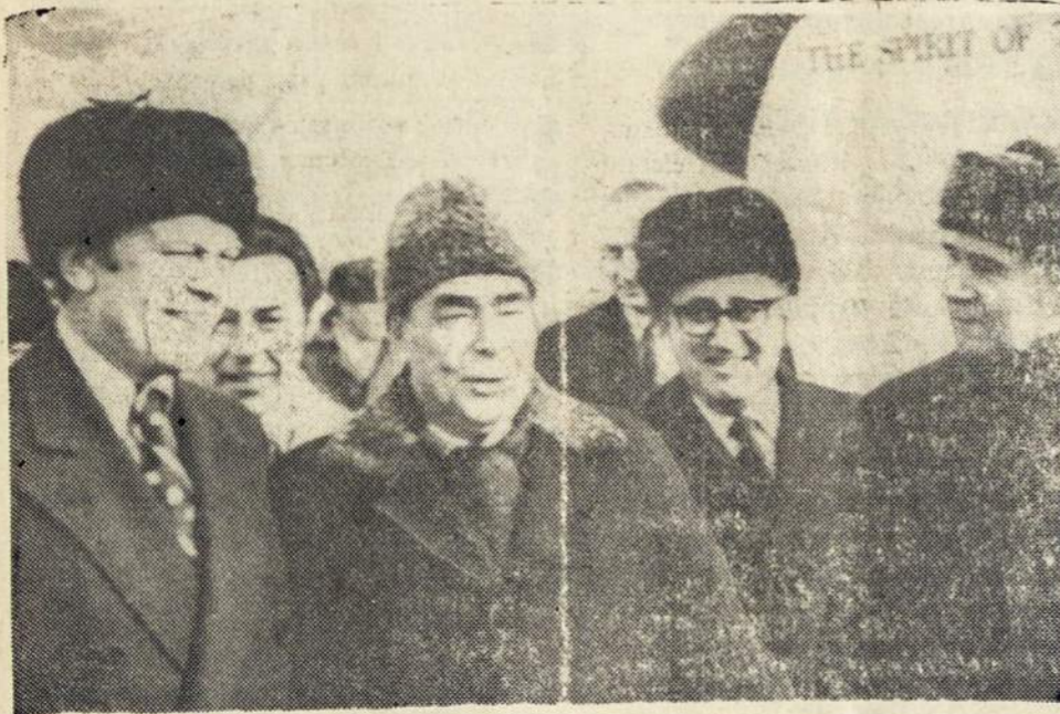
Buvo pasklidę gandai apie TS kp. gen. sekretoriaus L. Brežnev sveikatos stovį, ir galima jo pasitraukimą iš užimamos vietos. Ji čia matome stovinti viduryje, tarpe didžiųjų politikų, Vladivostoke.