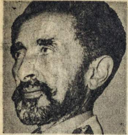
HAILE SELASSIE, buvęs Abisinijos karalius.

Žinios iš Abisinijos praneša, kad ten, Eritrejos provincijoje, prieš 12 metų prasidėjęs separatistinis judėjimas išsivystė į pietinį karą.