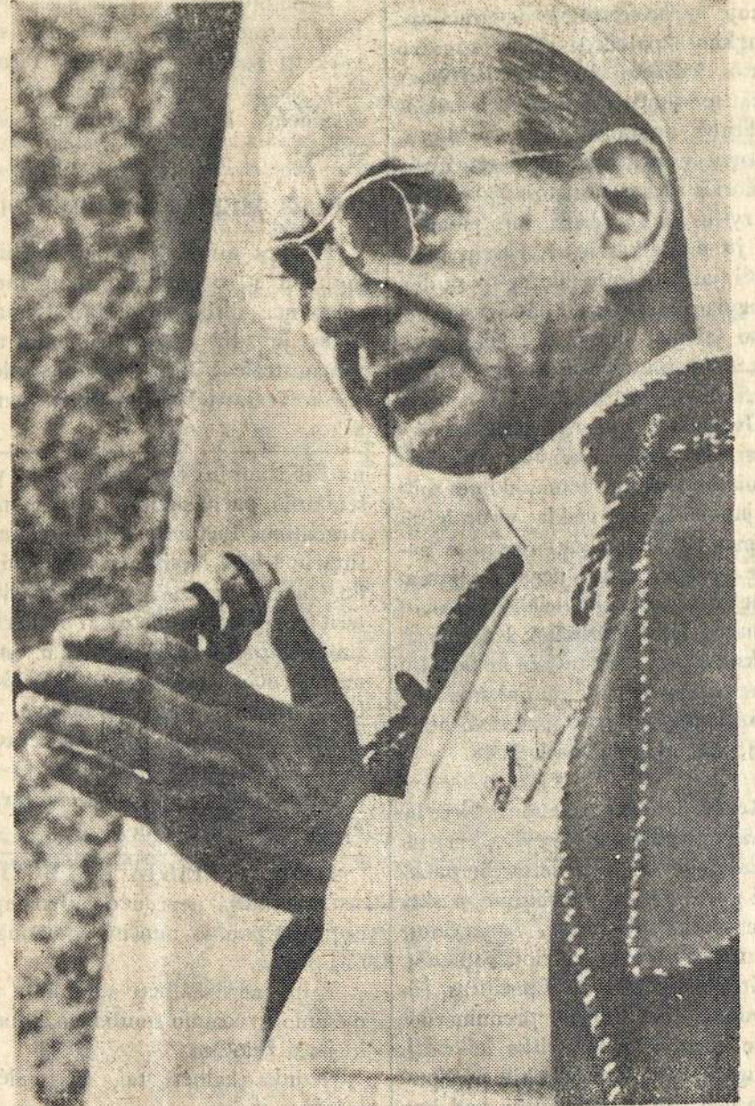
Popiežius Paulius VI Taikos dienos proga, gruodžio 19, atsisaukė į viso pasaulio žmonės ypatingai politikus, kad ieškotu taikaus sugyvenimo, nes nuolat ginkluojanties atominiais ginklais visa žmonija gali būti sunaikinta. Popiežiaus atsisaukimas rado plataus atgarsio taiką mylinčiuose kraštuose.