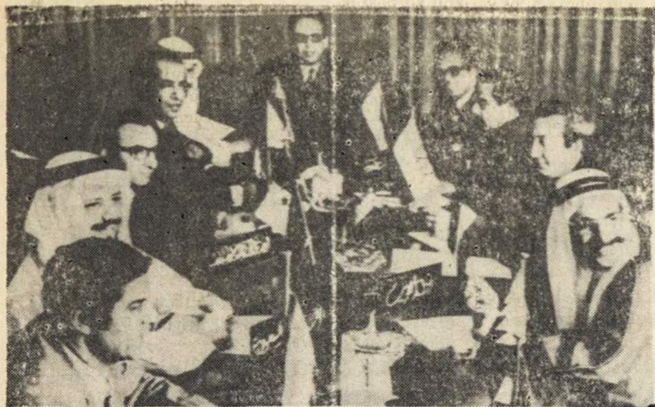
Arabų valstybių atstovai dažnai posėdžiauja ir tariasi, kaip daugiau laimėti prieš Izraelį, iš tu valstybių kurios perka iš jų naftą.