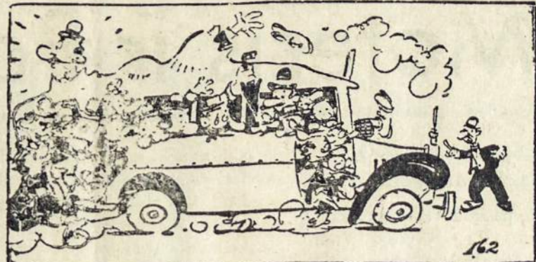
Važiuojant į N. Metų sutikimą — bukit atsargūs!