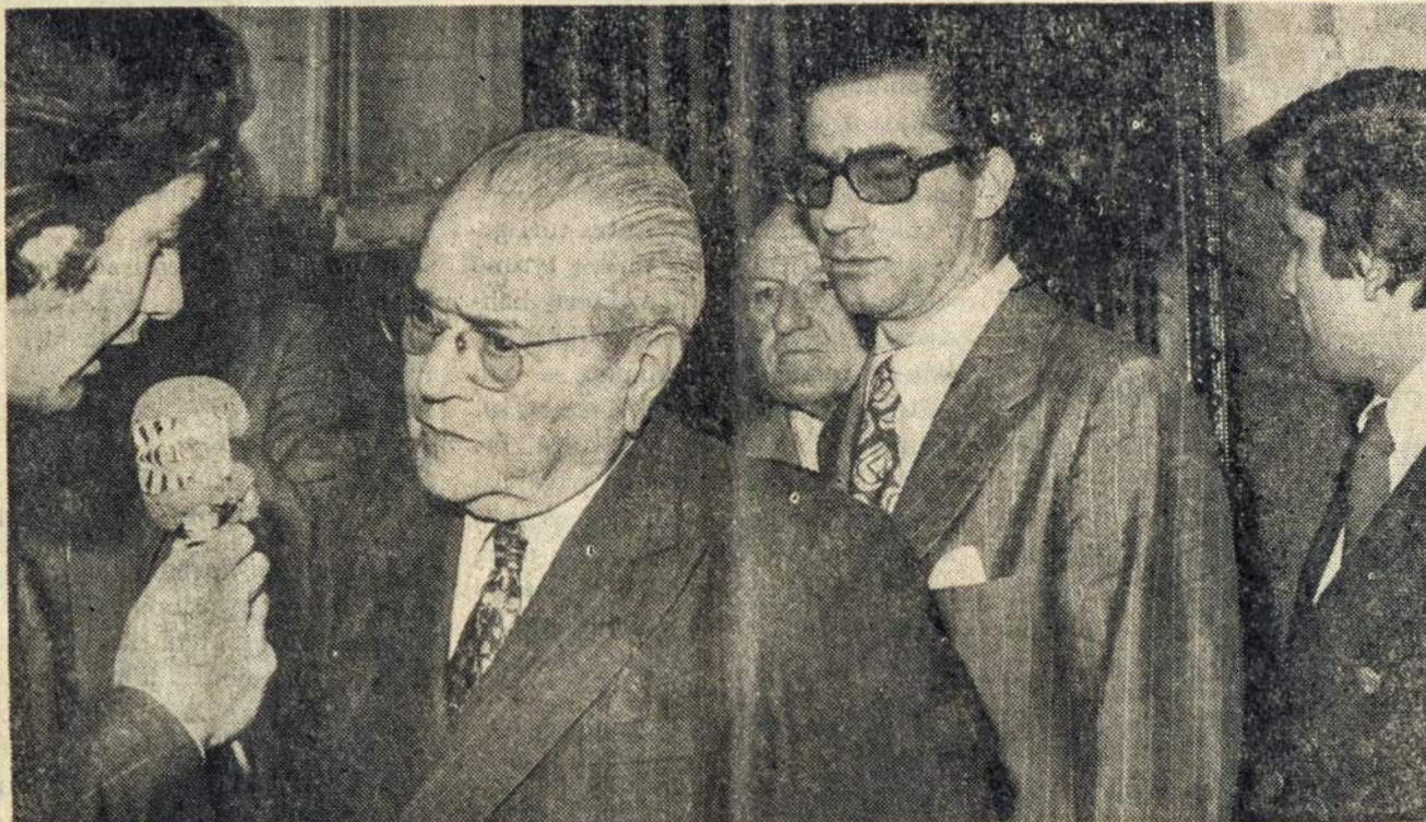
Union Civica Radical partijos vadas adv. Ricardo Balbin buvęs kandidatas į prezidentus, dabartinis opozicijos vadas, viešai pareiškė, kad po gen. J. D. Peron mirties daug kas pasikeitė. Bet nežiūrint pasikeitimų niekas nenori revoliucijų ir visų noras yra, kad būtų konstitucinė tvarka ir įvyktu savo laiku numatyti visuošni balsavimai.