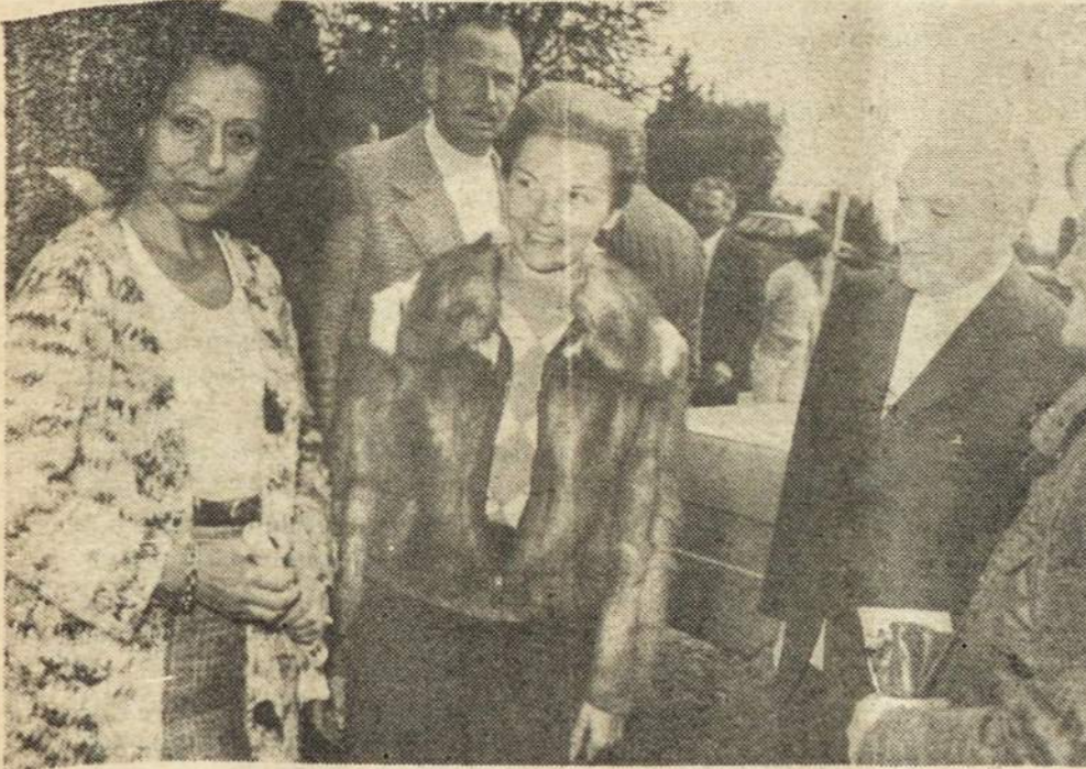
Argentinos prezidentė M. E. Martínez de Perón, vasarodama Mar del Platoje buvo nuvykusi net į Ushuaia. Paveiksle matome prezidentę besikalbant su vietos gyventojais.