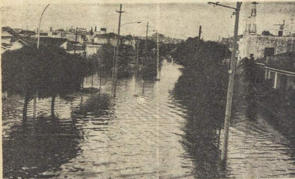
Kordobos kalnuose vasario mėn. pradžioje buvo tokie dideli lietūs, kad užtvindė daug vasarviečių kuriuose žuvo net 11 žmonių, daugumoje turistų, kurie nespėjo laiku pasišalinti nuo vandens applūdžio.