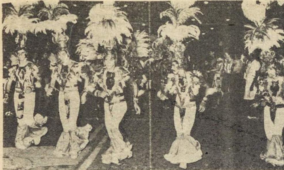
Argentinos Karnavalų linksmybės. Corrientes mieste eina smarkios varžybos tarpe įvairių grupių kovojančių dėl pirmos vietos. Buenos Aires mieste karnavalų kaip ir nebuvo.