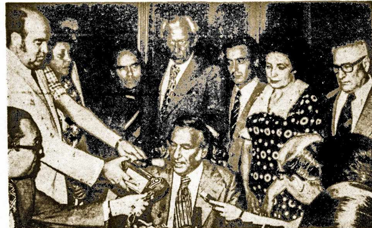
Raūl Lastiri, laikraštinių klausinėjamas apie nesutarimus Justicialistų partijoje, ir nesutarimus su Romos Katalikų bažnyčios vyriausybe. Lastiri pasakė, kad ir Justicialistų partijoje ir su dvasiškija, nesutarimai išaiškinti.