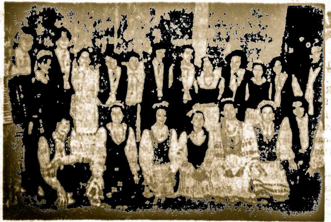
Šeštadienį, kovo 8, 8 val. ryto, nuo A. L. Centro išvyksta į Rosario ALC tautinių šokių ansamblio šokėjai, kad dalyvauti Sv. Kazimiero parapijos šventėje, Rosario mieste. Važiuoja jaunimas ir tik iš anksto užsirašiusieji. Grįžta sekmadienį 20 val. į ALC.