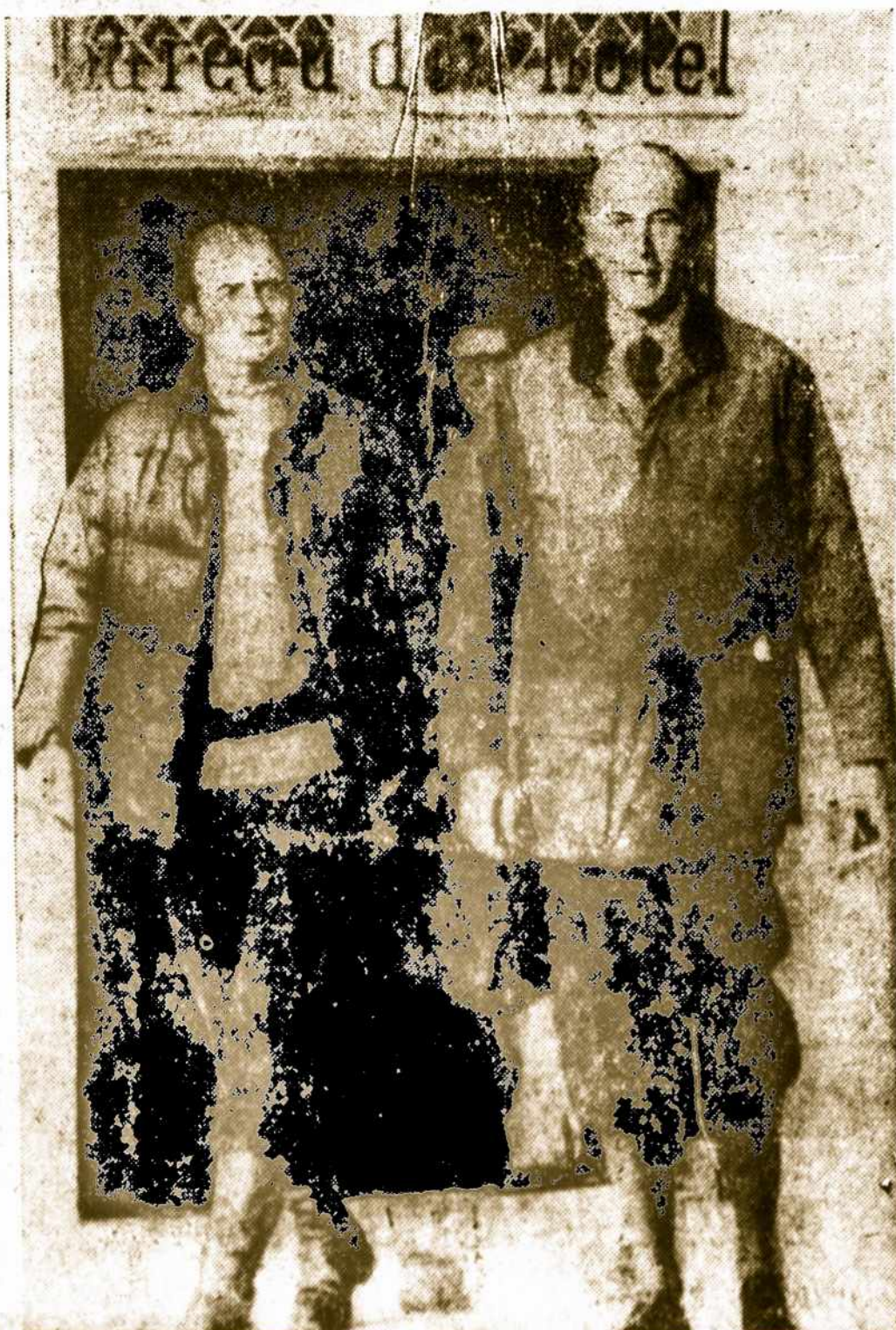
Stiprinami ryšiai tarp Ispanijos ir Prancūzijos. Paveikslė busimas Ispanijos karalius princas J. C. de Borbón (kairėje) su Prancūzijos prezidentu Valery Giscard d'Estaing, išcina iš hotelio ir vyksta medžioti į Chambord (Prancūzijoje).

◆ Sumažėjus statyboms, ateinančiais metais numatoma iš Anglijos eksportuoti 35 mil. plytų.