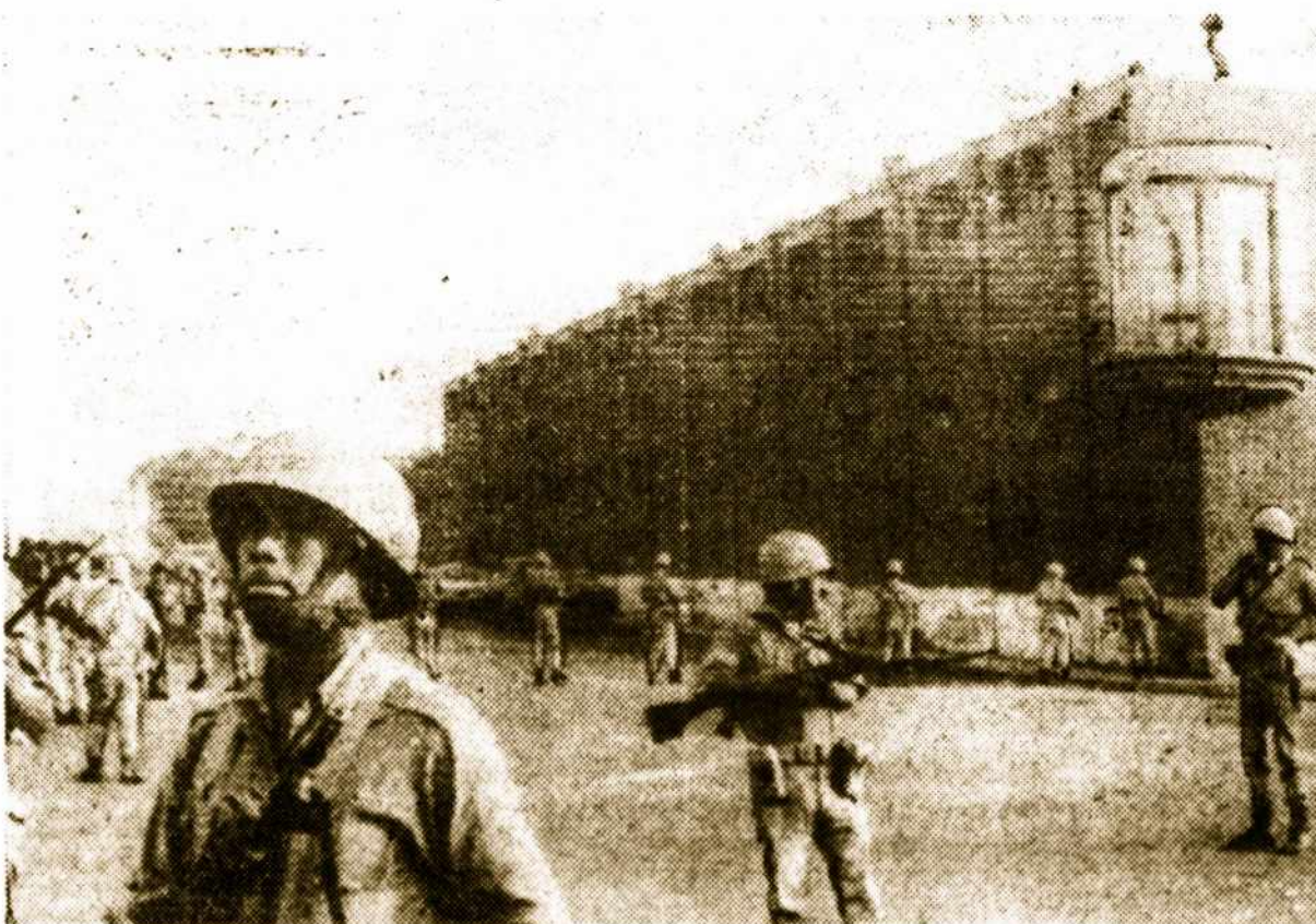
Peru valstybės, sostinėje Lima, buvo sukilusi Nacionaline Gvardija, kuri tikrumoje turi palaikyti tvarką krašte. Ja numalšinti turėjo isikišti kariuomenė. Riausėms prasidėjus buvo apiplėštos prekybos ir sunaikinta už daug milijonų turto. Valdžia kaltina dešiniuosius Apristus riaušių sukėlime. Numalšinus sukilėlius daug areštuota ir teisiama karo teismo už betvarkės kelimą. Paveiksle matomos kariuomenės saugomos ištuštėjusios Limos gatvės