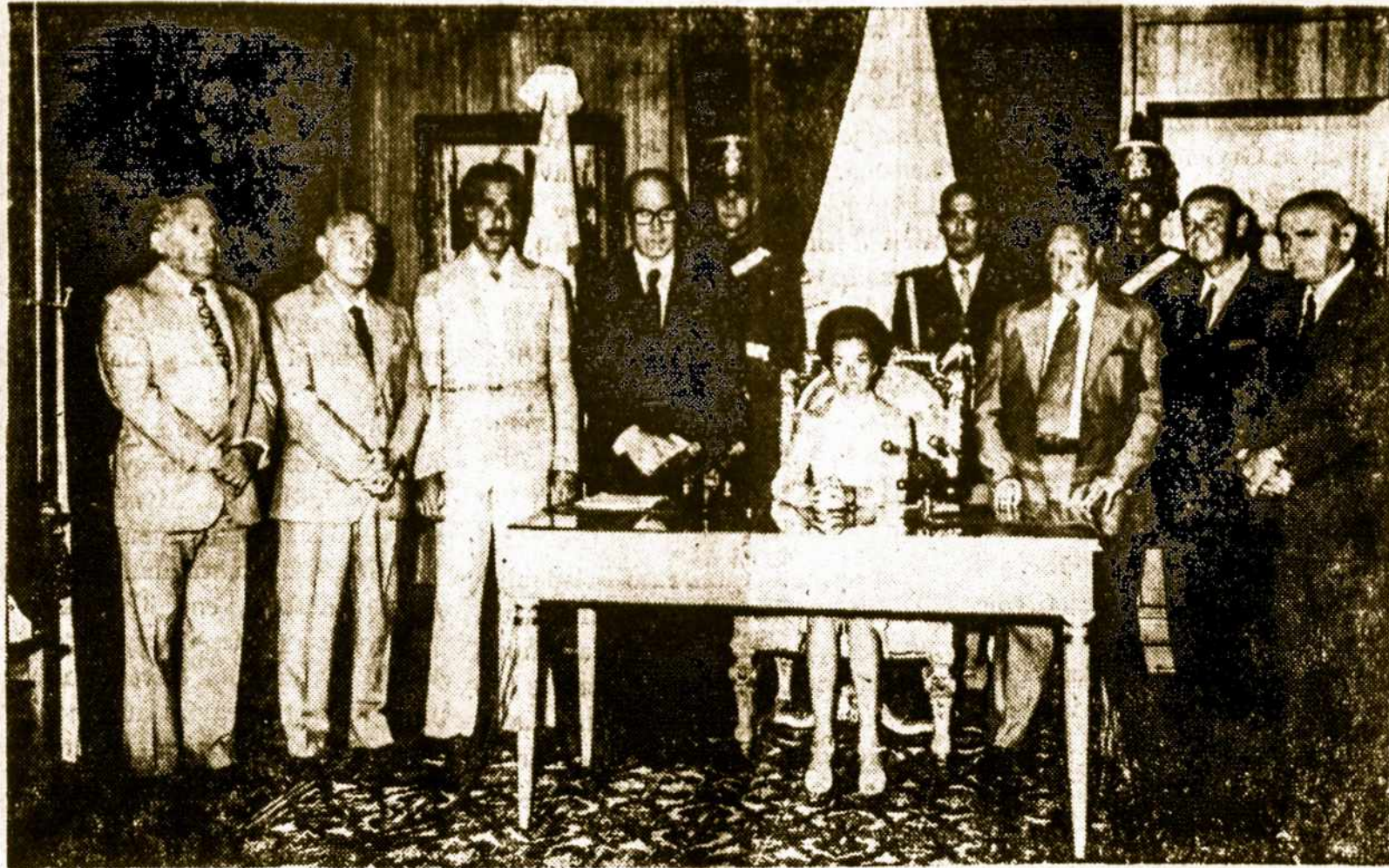
Prezidente M. E. M. de Perón, dalyvaujant Ekonomijos Darbo, Socialinio Gerbuvio ministrams ir Darbo Konfederacijos generaliniam sekret. viui, 1. 3. 75 paskelbė algų pakėlimo 400 pezu L, bet kartu kvietė darbininkus pakelti gamybą, kad nereikėtų kelti gaminiams kainų.