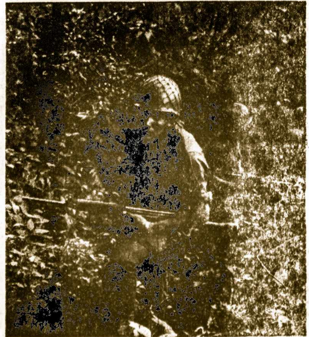
Tucuman provincijoje vyksta kariški veiksmai prieš partizanus. Dalyvauja policijos ir kariuomenės daliniai. Paveikslė: kareiviai supa miškingas vietas, kur mamoma yra įsistiprinę partizanai, Susirėmimuose, iš abiejų pusių, žuvo kovotojai.

Metams pasibaigus-reikia atnaujinti prenumeratas