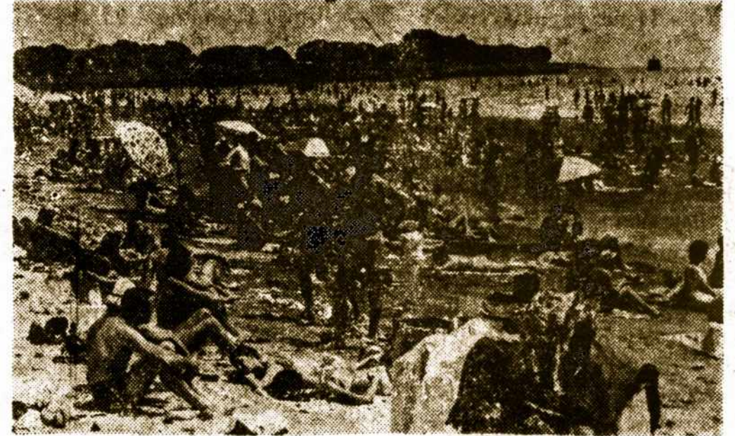
Užėjus vasaros karščiams netik Mar del Platos bet ir Buenos Aires visi paplūdimiai pilni poilsiaujančių, saulės ir tyro oro ištroškusių žmonių.

Garantuotai taiso laikrodžius ir naujus, parduoda geros rūšies laikrodžius su garantija.