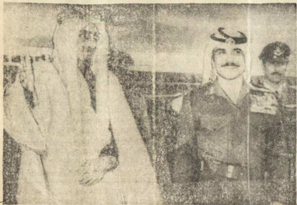
Jordanijos ir Saudi Arabia karaliai tariasi kokia vesti politika Arabų — Izraelio konflikto atveju. Šie abu karaliai yra geri draugai JAV. Bet jie negali priešintis Arabų Lygos nutarimams.