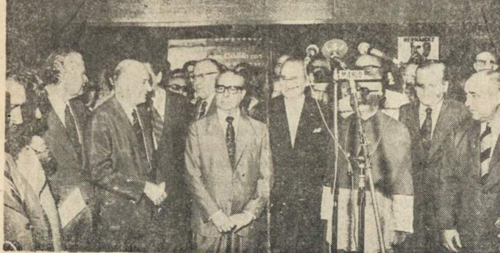
Iškilmingai buvo atdydaryta Internacionalinė Knygos Paroda, Municipalityto ekspozicijų salonose, Figueroa Alcorta ir Pueyrredón gatvių sankryžoje. Atydarime dalyvavo Švietimo, Teisingumo ministrai, Senato pirmininkas, Buenos Aires Miesto Intendentas ir užsienio atstovai, tu valsybių kuriu leidyklos dalyvauja parodoje.