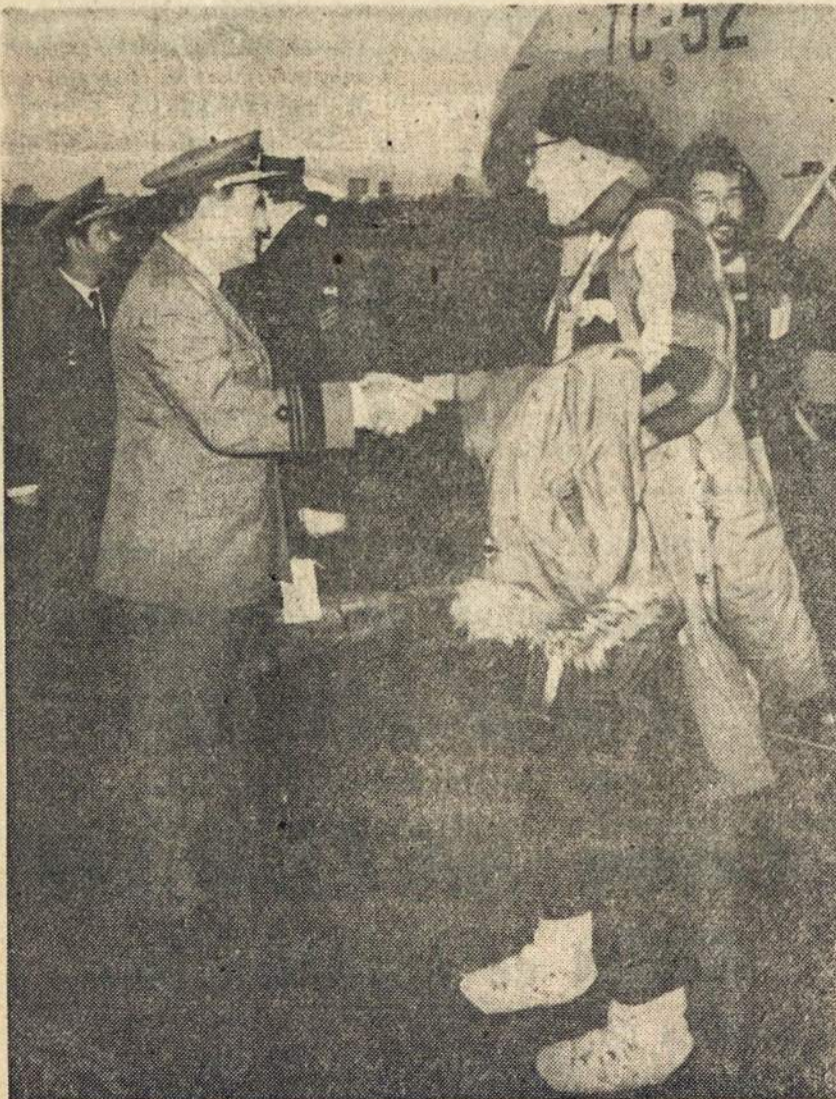
Antartidoje išalus JAV laivui Glacier, jo įgula buvo evakuota Argentinos orlaiviais. Nuotraukoje vienas iš jureivių sveikinasi su Argentinos aviacijos viršininku.

69 metų amžiaus, kuris Argentinoje pradėjęs prekybinę veiklą žaibiškai išsturtėjo, mirė Paryžiuje 15. 3. 75. Jo turtai siekią pasakiškas sumas dabar paskirstyti tarp jo dukters Christinos ir žmonos Jacqueline, kuri gaus 600.000.000 dol. Palaidotas Scorpion saloje, kuri yra jo nuosavybė, šale sūnaus Aleksander, prieš du metus žuvusio aviacijos nelaimėje.