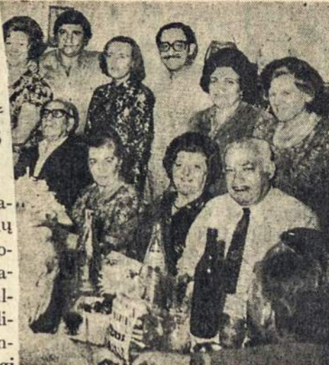
nga sukaktis buvo gražiai atžymėta jų tarpe. Galė stalo laimingas sukaktis, dukters ir anukės.

Z. Stoberskis, Lodzės leidykla atidavęs į lenkų kalbą išverstą lietuviškų apsakymų rinkinį, nagrinėja lietuvių apsakymo raidą. Numeris gausiai iliustruotas.