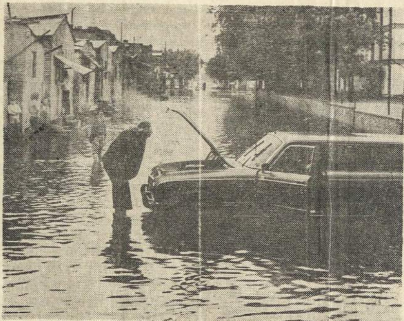
Argentinos provincijuose potvyniai pridarė daug nosterliu. Daugelis gyventojų laikinai turėjo apiešti gyvenvietes. Daug turto tapo vandens sunaikinta. Nuotraukoje žmogus nori išgelbėti skestanti automobilį.

Argentinos Lietuvių Balsas yra Argentinos lietuvių balsas! prenumeruokime jį sau ir draugams.