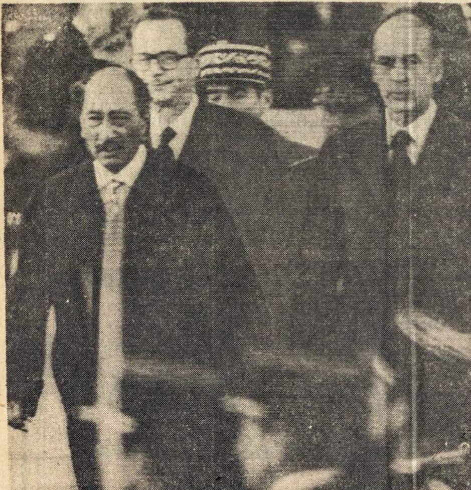
Egipto prezidentas Anvar Sadat orientuoja savo politiką link Europos valstybių. JAV atvirai remiant Izraelį, arabų kraštai, ypač dabar, po nužudimo Saudi Arabijos karaliaus Faisalo, pradeda atšalti nuo JAV. Paveiksle: Egipto prezidentas su Prancūzijos prezidentu.

◆ Liros vertė nukritus, Vatikanas taip pat išgyvena krizę. Apie 3.000 tarnautojų gali netekti darbo. Vatikanas išlaidos yra apie pusę milijono svarų per mėnesį.