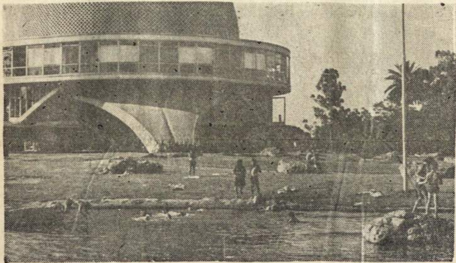
Buenos Aires mieste, gražiuose Palermo parkuose esantis Planetariumas patraukia daug jaunimo, kuris idomaujasi astronomija ir nori susipažinti su "dangaus kūnais".