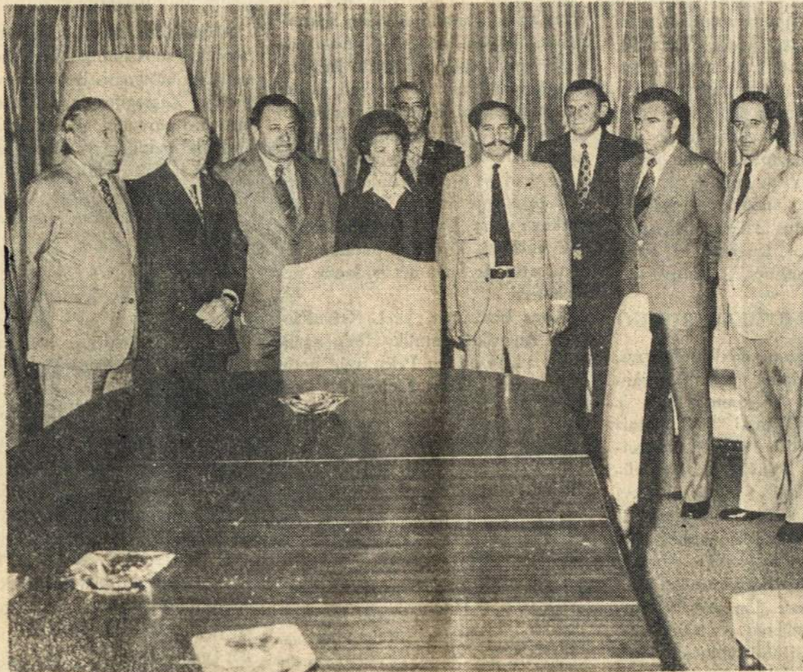
Argentinos presidente M. E. M. de Perón, sekdamas savo vyro, prezidento generolo Perón ipročius, pradėjo lankytis Generalinės Darbo Konfederacijos (CGT) bustinėje, ir tęsti politinius ir ekonominius klausimus pokalbius su darbininkų organizacijų vadais. Paveiksle: prezidente CGT bustinėje.