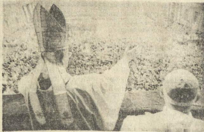
Romoje, San Pedro aikštėje, Velykų švenčių proga susirinko 200.000 italų ir turistų, kad gauti Popiežiaus palaiminimą.