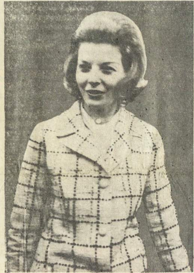
Argentinos prezidentė M. E. M. de Perón Moters Dienos proga pasakė plačią kalbą moterims, kurių buvo susirinkę virš 3000. Jos kalba buvo perduota per Radio ir TV visai Argentinos teritorijai ir užsieni.