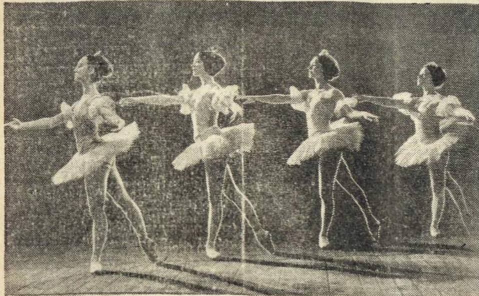
Vilniaus meno mokykloje—baletu skyriaus pamokų metu būsimos šokėjos.