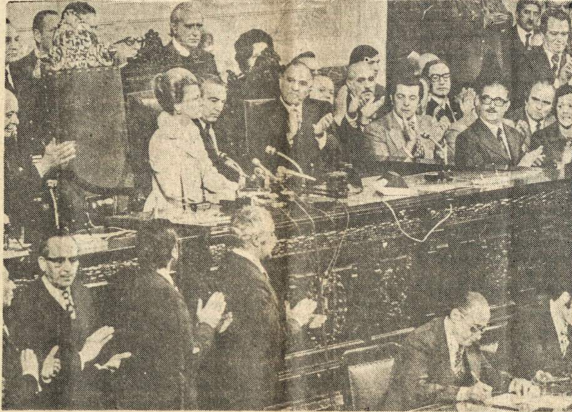
Gegužės 1, 75, Argentinos Prezidentė Maria E. M. Perón kalba Argentinos Kongreso (parlamento) metinėje sesijoje. Iš klausiusi visų Ministrų, kiekvieno atskirai, pranešimus Prezidentė padarė bendrą politikos ir krašto ekonominės padėties apžvalgą, Užgyrė Ministrų darbus, pareiškė padėką Ministrams ir Kongreso nariams už vieną veiklą siekiant krašto gerbuvio.