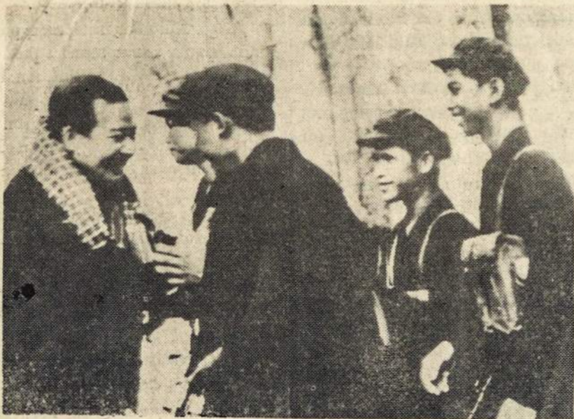
Kambodijos princas Norodom Sihanouk sveikina rauduoniusius "khmer" kovotojus, laimėjusius prieš Lon Nol valdžią po 6 metų neatlaidžios partizaninės kovos.