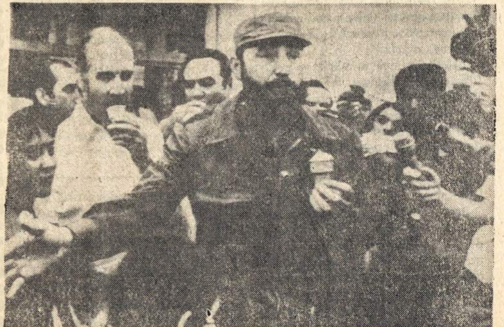
JAV ir Kubos suartėjimas. Paveikslė: Kubos Fidel Castro ir JAV kongreso atstovas, buv. kandidatas į prezidentus, George MacGovern, kuris vedė pasitarimus su Kubos valdovu, tų kaimyninių valstybių, suartėjimui.

◆ Kinijos vyriausybė netiesioginiai išpėjo dr. Kissingerį, kad Amerika turėtų atšaukti Formozos pripažinimą.