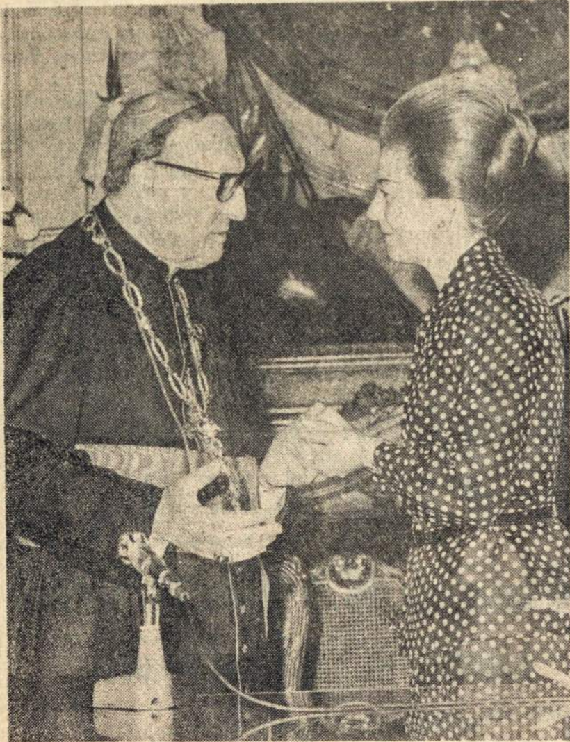
Argentinos Prezidentė atsisveikina su Buenos Aires Arkivyskupu, Argentinos primatu Mons. Antonio Caggiano, jam dėl amžiaus pasitraukus iš virš mimetų pareigų. Jo vieta dabar užėmė Mons. Juan Carlos Aramburu.

◆ Persija numato perstatyti ir modernizuoti savo sostinę Teheraną. Naujasis planas kaštus daugiau kaip 2 tūkst. mil. svarų.