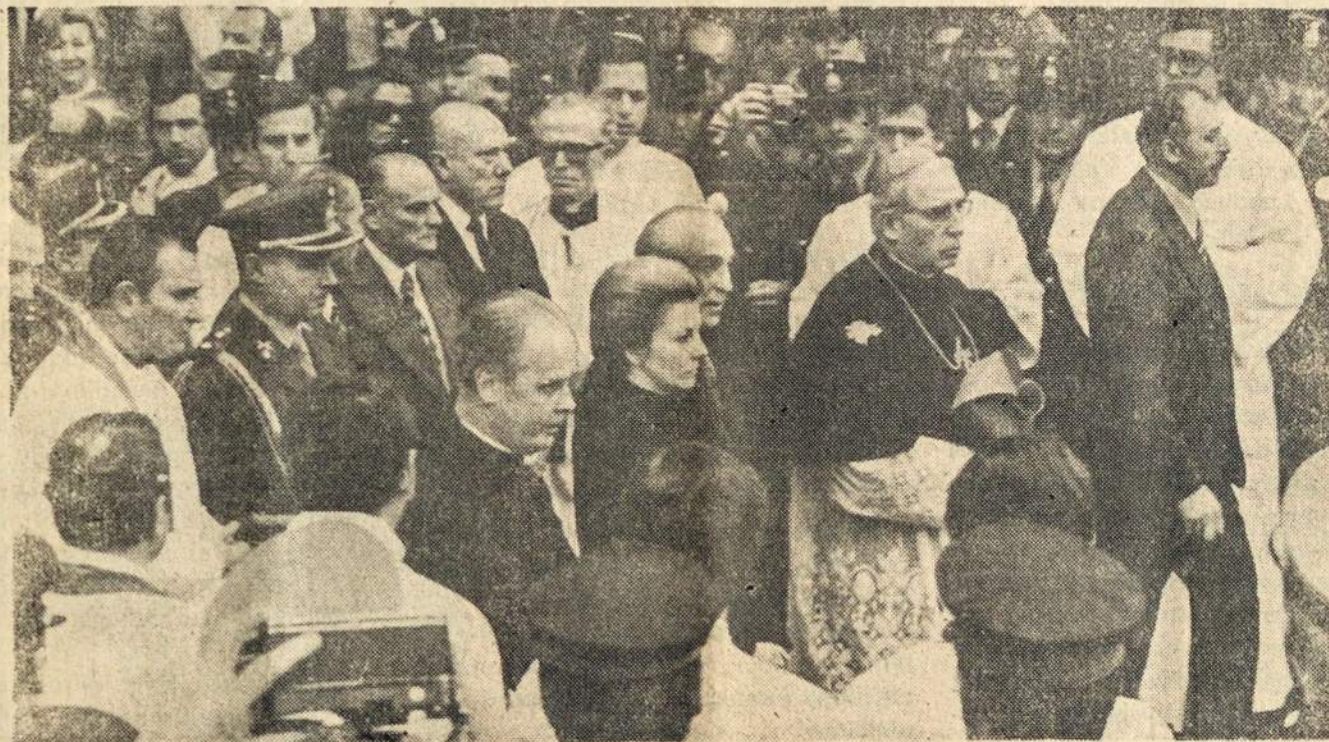
Lygiai prieš metus, liepos mėn., mirė Argentinos prezidentas gen. Juan D. Perón. Viena iš daugelio padarytų nuotraukų tuo metu.