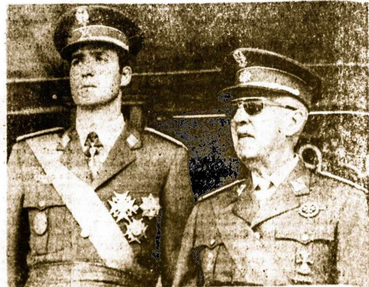
Gen. Francisco Franco 36 metus despotiškai valdė Ispaniją, sulaukęs 83 metų amžiaus, kad ir sunkiai sergantis iki paskutinės savo gyvenimo valandos nenorėjęs atsakyti valdžios princui Juan Carlos de Borbon naudai. Nuotraukoje Franco su princu, kuriam jis, lyg savo sūnui, perdėdo valdžią, nežiūrinti esant stipriam pasipriešinimui iš Ispanijos politinių sluoksnių. Gen. F. Franco po sunkios ilgai kankinančios ligos mirė 20. 11. 75.

Prie Liverpoolio numatyta pastatyti pirmuosius devynis saulės energija apšildomus namus gyventi.