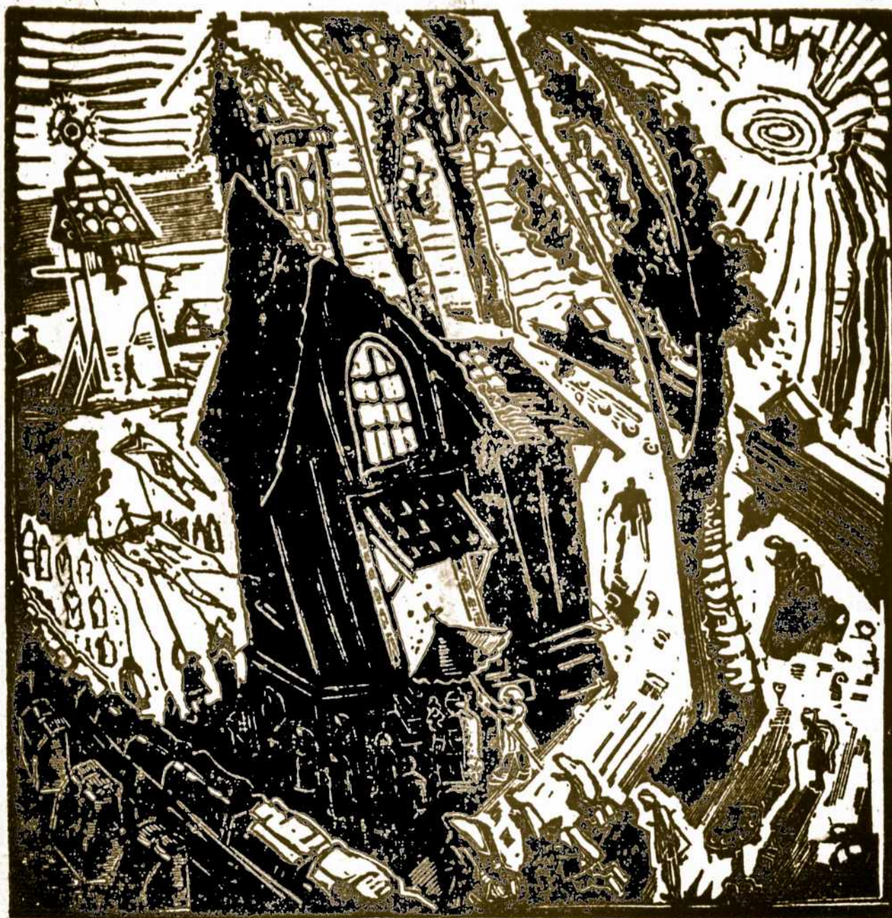
Velykų rytas Lietuvoje.