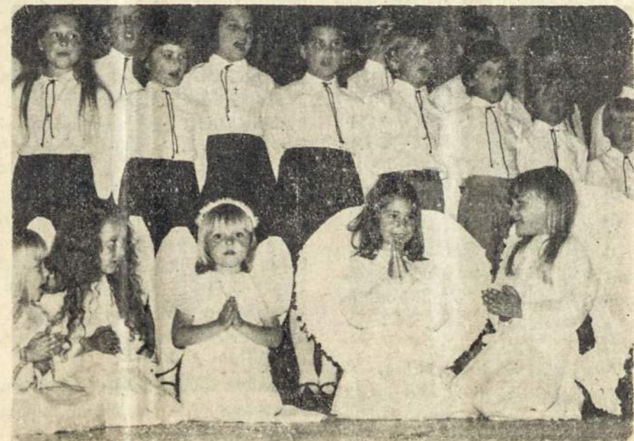
Hektoro Katino nuotraukoje vaikučiai dalyvavę prakartėlės pastatime.

♦ Arg. Liet. Centro jaunoji karta intensyviai ruošiasi Lietuvės Motinos Dienos paminėjimui, kuris, kaip ir kitais metais įvyks gegužio mėn. pradžioje. Laukiama, kad visuomenė nebus abejinga jauniosios kartos pastangoms pažvaizinti pilką kasdienybę.