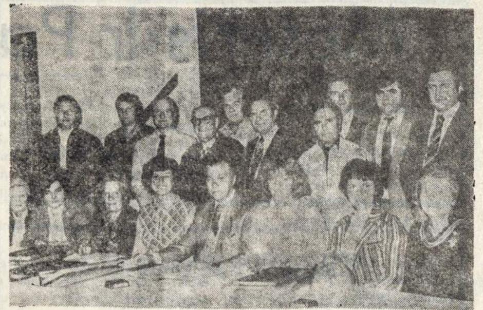
Visuotinio Argentinos Lietuvių Centro susirinkimo, įvykusio 26. 4. 81, išrinkta nauja Valdyba 1981/82 laikotarpiui. Visų pavardes ir pareigos telpa atskirai, straipsnyje apie susirinkimo eiga ir rinkimus.