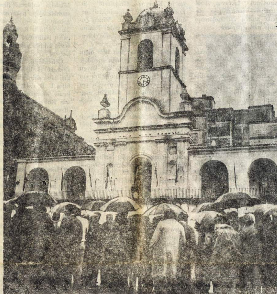
Revolución de Mayo: EL PUEBLO QUERE SABER DE QUE SE TRATA...