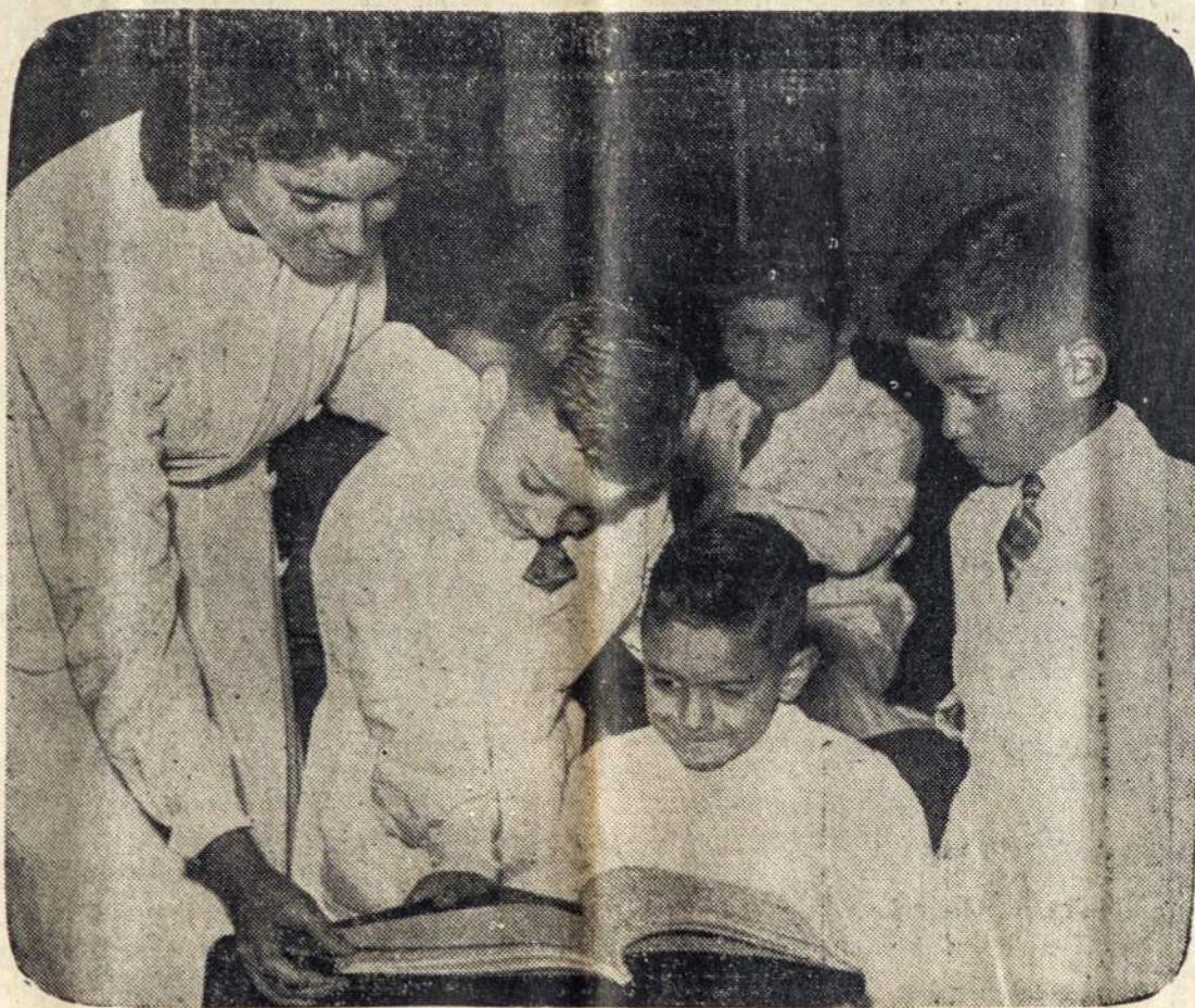
Argentinoje visuose mokyklose prasidėjo mokslas. Nuotraukoje pradinės mokyklos mokytoja su pirmaklasiais mokiniais aiškina jiems dar neiškišus pradinio mokslo dalykėlius.

◆ Sibiro dujotekio projekte nemažą vaidmenį turi JAV pramonininkai ir jų kapitalas. Per praėjusius metus, Tarybų Sąjunga pirkė už 165 mil. dolerių specialiu dujotekio vamzdžiams tiesyti traktorių ir atsarginių jiems dalių. Tačiau amerikiečiai visą laiką reiškė abejones ir išpejo V. Europą dėl galimų pavojų atcityje. Po Lenkijos įvykių, prez. Reaganas buvo nutaręs dar grieščiau apriboti amerikiečių įnašą. Dabar viso galutinis nutarimas atidėtas.