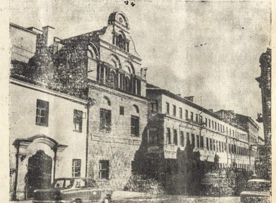
Restauruoto Kauno senamiesčio Vaizdas — Perkūno namų fasadas.