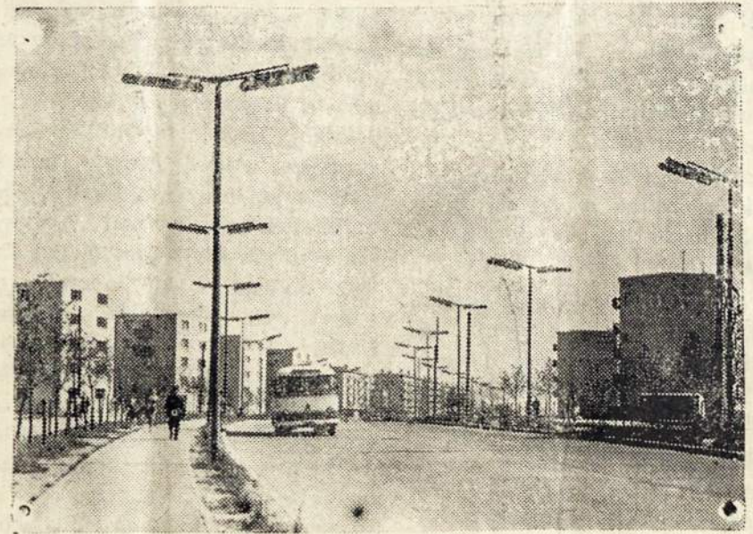
Lietuvos miestai ir ju priemėsčiai tojimui elektrą yra labai pigi. Daudmoderniškais šviestuvais apšviesti. gelis vartoja elektrines viryklas, nors Kaip žinome, Lietuvoje namų var yra ir labai pigios natūralios dujos.