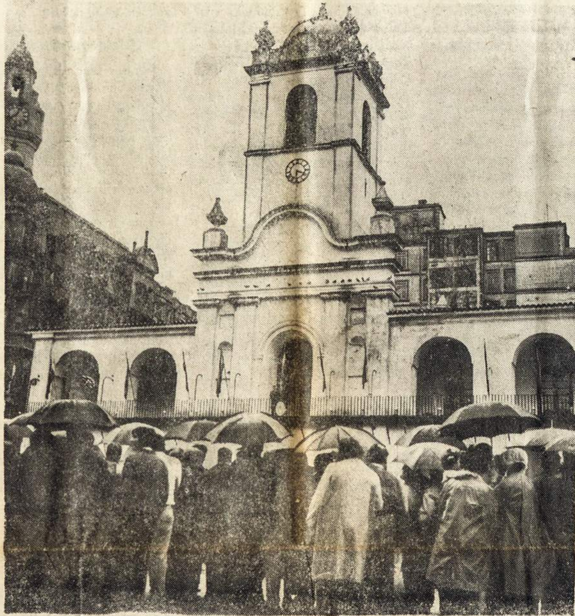
GESTA DE MAYO DE 1810