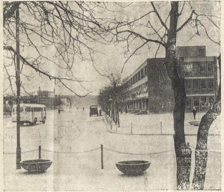
Lietuvos miestai gražėja, puošiasi vaizdas žemos metu padengtas balnaujais pastatais. Provincijos miesto ta sniego danga, atrodo labai gražu.

Muziką kompozitorius Br. Bu (Pabaiga 6-me puslapyje)