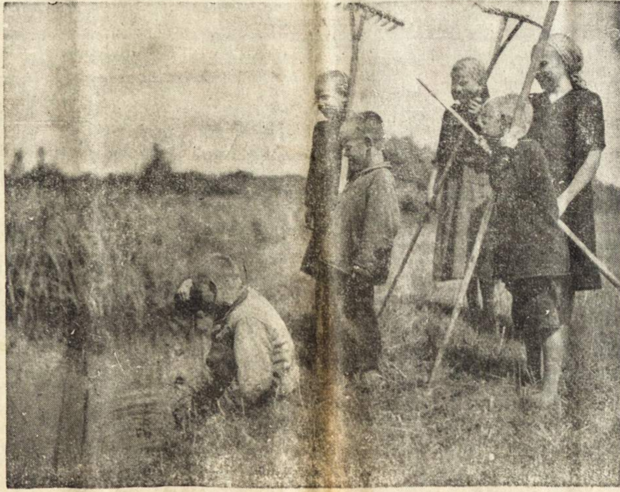
Seniau Lietuvoje ir mažamečiai dirbdavo sunkius lauko darbus. Dabar agrotechnika pakeitė gyvenimą.