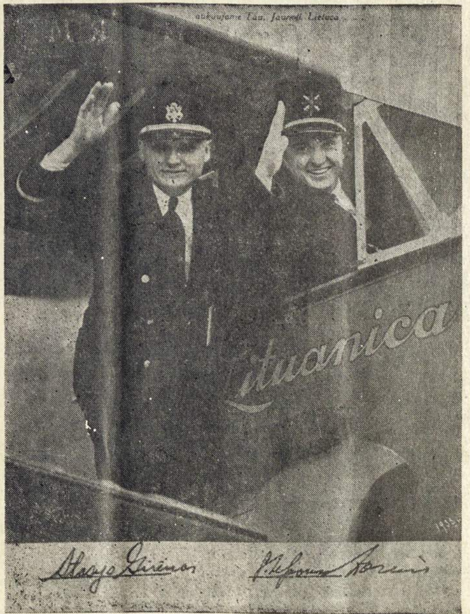
Juos prisiminsime, liepos 25 d. 1982, 17 val. Argentinos Liet. Centre.