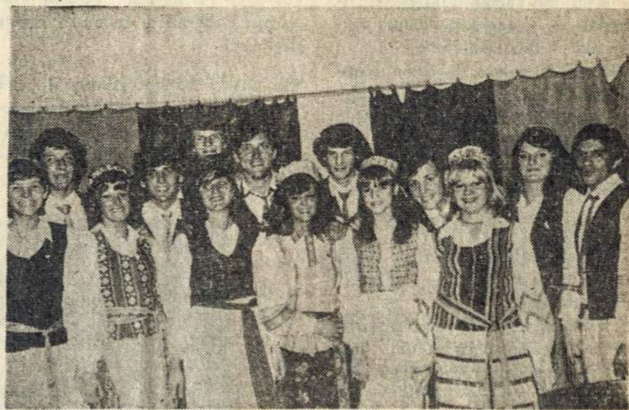
Berisso miesto lietuvių tautinių šokių vadovaujamas, sėkmingai koncertuojąs lietuvių ir argentiniečių publika.