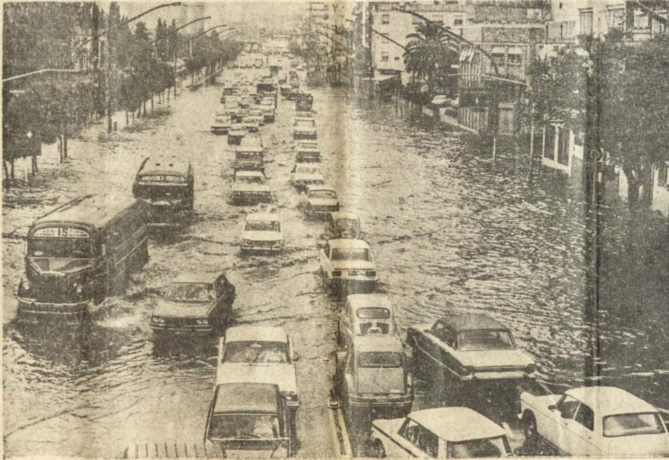
Taip atrodo Argentinos provincijos Formosa miesto gatvės, laike katastrofiško potvynio. Daug nuostolių.