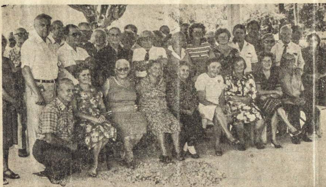
Argentinos Lietuvių Senelių Židinio, naujo pastato — salonėlio pastogėje susirinkę tautiečiai. Pr. Ožinsko nupaveiksluoti stulpų pašventinimo proga. Plačiau telpa trečiame puslapyje.

(Daugiau užuojautų kituose laikraščio puslapiuose)