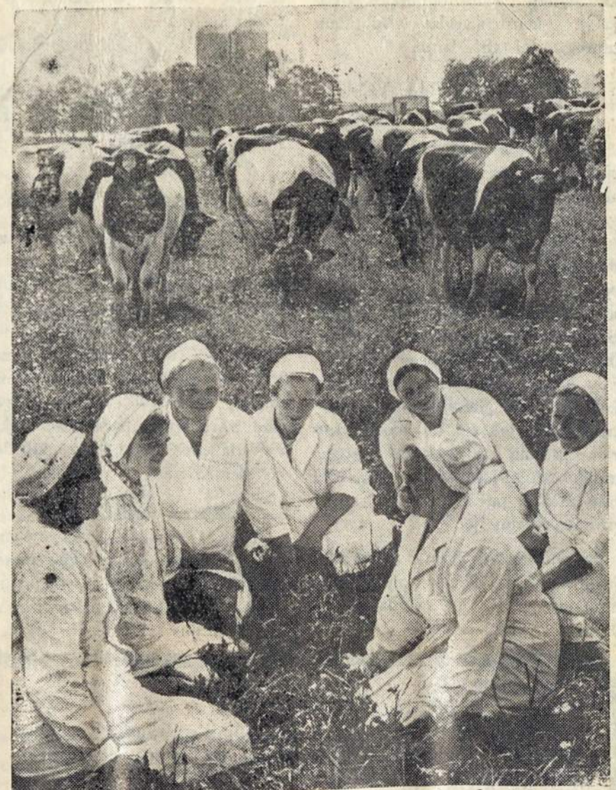
Melžėjų atvangos valandėlė. Lietuvoje labai išvystyta piemininkystė. Karvės melžiamos mašinomis, todėl ir melžėjų darbas yra gerai apmokamas ir aukštai vertinamas. Paviekslė bendrauklio juodmargės.