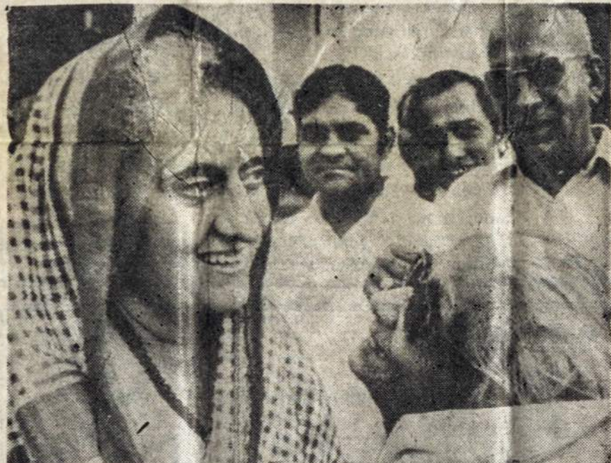
Indira Ghandi, moteris kuri valdo 450.000.000 tautą, dėl jos diplomatinę gabumų ir sugebėjimo, jos šalis, gražiai sugyveną su visu pasauliu.