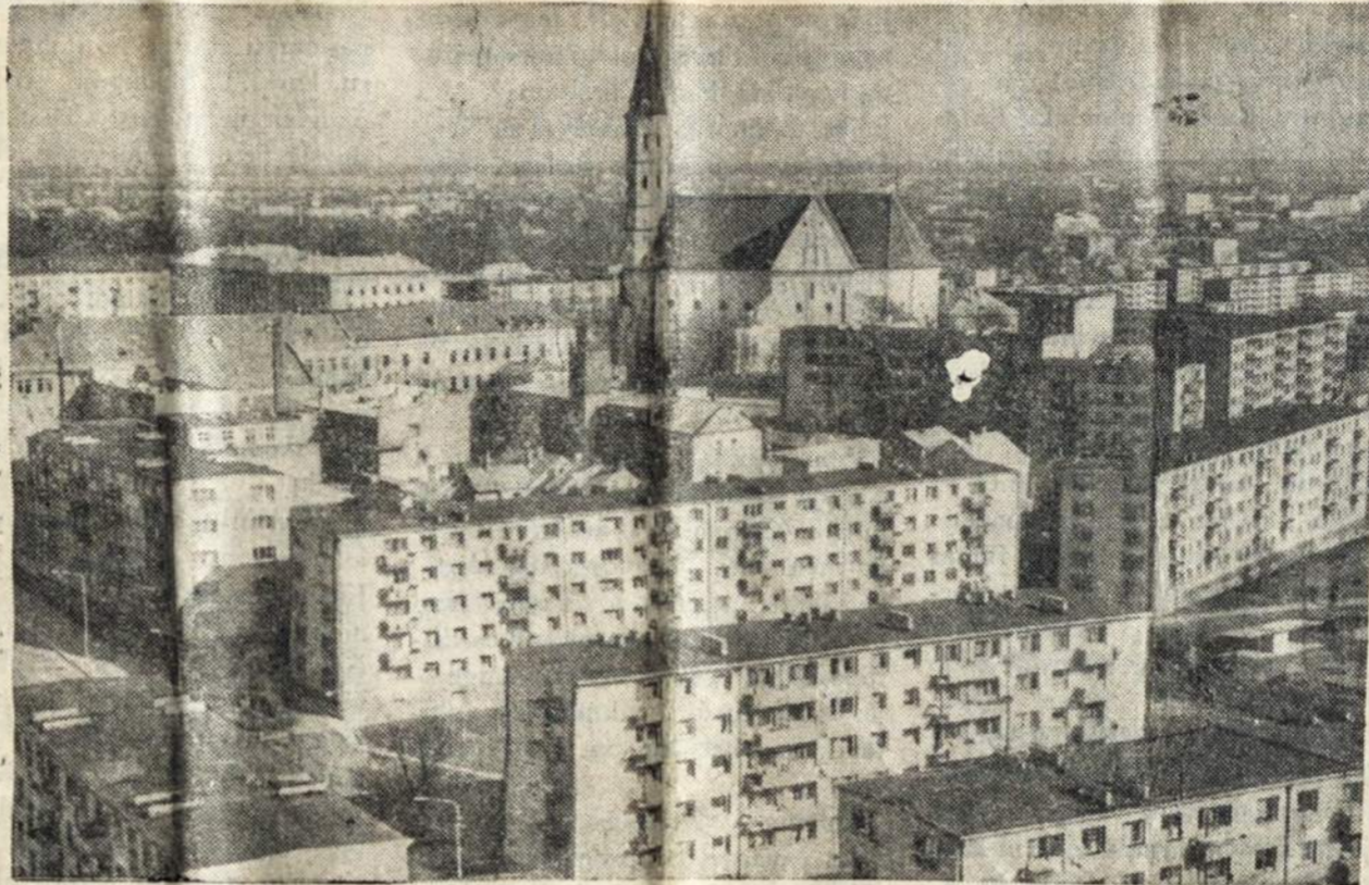
Šiaulių miesto vaizdas, su aukščiausia bažnyčia Lietuvoje. Nuotraukoje naujų namų kvartalai. Miestas, per karą sugriautas gražiai atsistatė, neatpažįstamai.