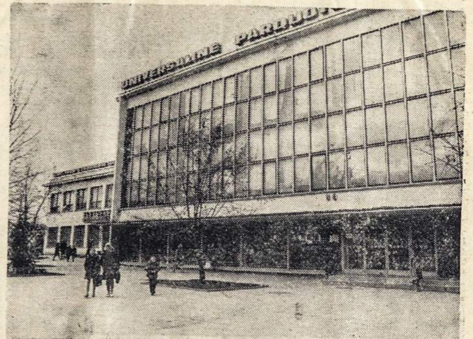
LIETUVOS MIESTAI NUOLATOS AUGA IR PUOSIASI NAUJAI PASTATAIS SU VISU KONFORTU. NUOTRAUKOJE UNIVERSALI PARDUOTUVĖ, KURIŲ YRA DAUGELYJE MIESTŲ