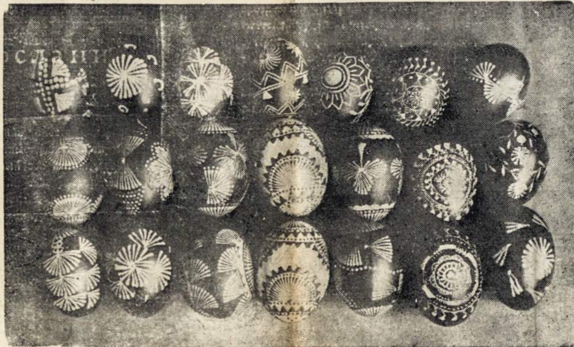
Velykos, Velykos ir kas jūsų nelaukia, ypatingai Lietuvoje, kadan gi ten su Velykomis ateina ir pavasaris, pabunda gamta, žmonės sveikina pempės, čilba veverčiai. Žmogus kartu atgyja ir džiaugiasi ne tik meniškai da žytais margučiais bet ir atsinaujinu sia gamta, po šaltos žiemos.