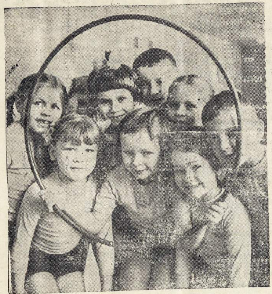
Argentinos vaikai "užgulę" ant knygų mokosi, o tuo tarpu Lietuvoje, moksleiviai gerai nusitelkę, linksmai atostogauja ir stovykluose sportuoja.

A. L. Balsu Leidykla dėkoja visiems kurie be paraginimo užsimoka prenumeratas. Siuntinėjimas paraginimų daug kainuoja ir apskunkina Administracija darbu. ALB Admin.