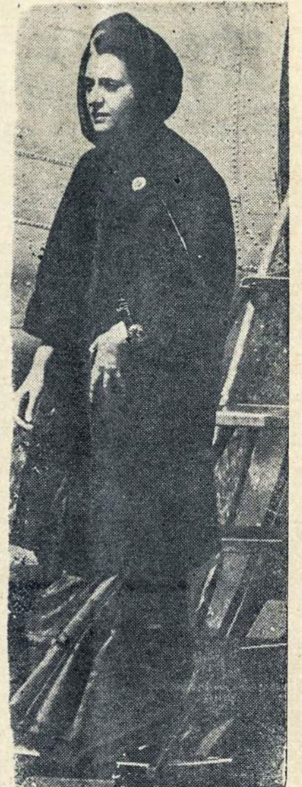
Nužudytą Indijos Premjerę INDIRA GHANDI

Gretimoje Urugvajaus Respublikoje, po 11 metų diktatoriško kariško režimo, demokratinėse rinkimuose laimėjo taip vadinamieji raudonieji, partido Colorado. Nauju prezidentu paskelbtas Julio M. Sanginetti.