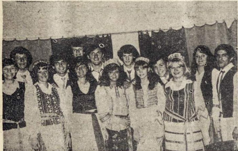
Berisso "Nemuno" asambliečiai kruo pščiai ruošiasi dalyvauti Šokių Šventėje. Taipgi dalyvaus ir Susivienijimo Lietuvių Argentinoje ansambliai.