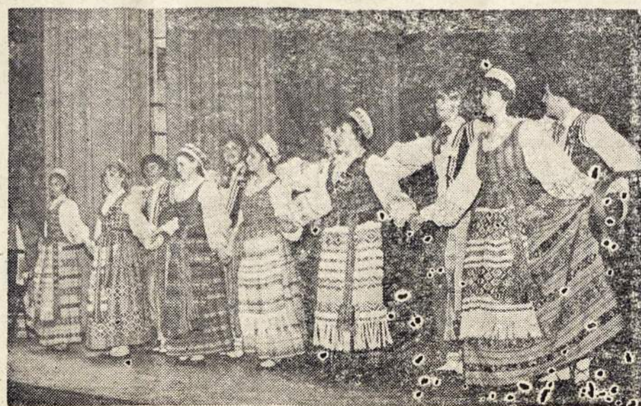
Argentinos Lietuvių Centro ansamblis "Inkaras" dalyvaus Pirmoje Tautinių Šokių šventėje Barisso mieste rugpjūčio 24, 85 m. Dalyvaus irgi!

Argentinos Lietuvių Balsas yra Argentinos lietuvių balsas — prenumeruokime jį sau ir draugams.