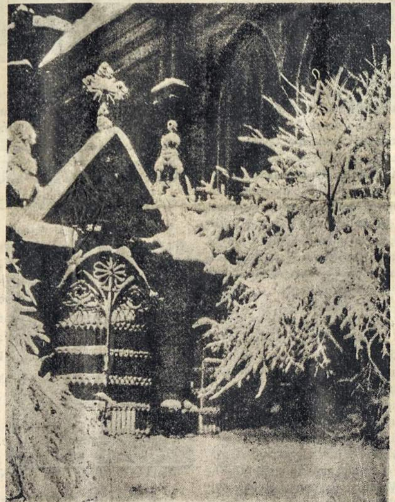
Žiemos metu taip atrodo Vilniaus apšerkšnyje bažnyčios varteliai.