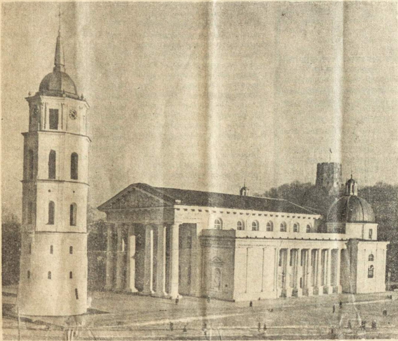
Vilniaus Gedimino aikštėje lenkų okupacijos laikais, net nedrašu buvo vyksta tūkstantinių minčių mitingai. Gedimino kalne ir vėl plėvėsuoja Lietuvos vėliava ir giedama Himna.

DIDINGAI PRAEJO VIII TAUTINIŲ SOKIŲ ŠVENTĖ