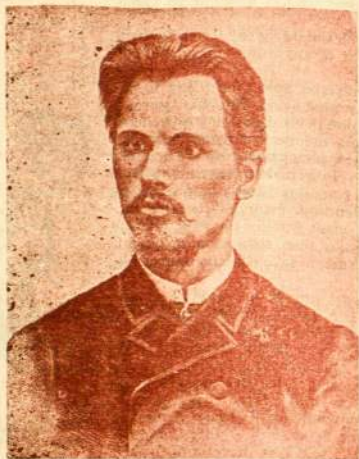
Dr. VINCAS KUDIRKA