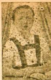
BIRUTĖLĖ ŠLEIVYTĖ, gražiai deklamavusi eilėraščius kultūriečių popietyje kartu su Feliksu Grigiuku (ne Grigu).