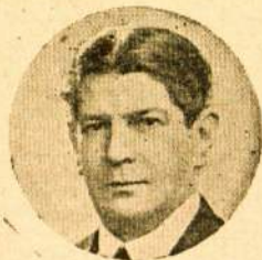
Dr. Juan José Amézaga Urugvajaus Respublikos Prezidentas,

Šią rezoliuciją, masinis Urugvajaus lietuvių susirinkimas įgalioja savo organizacijų vadus pasirašyti ir įteikti Urugvajaus Vyriausybei, visų šalių ambasadoriams ir spaudai.