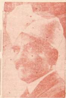
Sir A. Ramaswant Mudaliar

Didis kovotojas už Indijos nepriklausomybę, žymus politikas ir ekonomistas. Jis reikalautų anglus tuojau pašalinti.