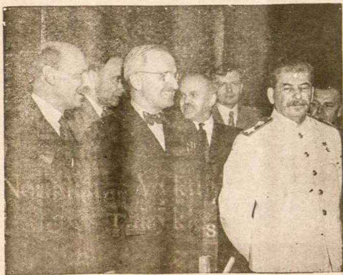
Iš kairės: Mr. Clément Attlee, Didžiosios Britanijos premjeras, Harry S. Truman, Jungtinių Amerikos Valstybių Prezidentas ir totalitarinės Rusijos diktatorius Stalin, nusifotografavę istorinėje Potsdamo Konferencijoje, kurioje buvo iškiltas ir Lietuvos klausimas, svarstant bolševikų bazės teises Karaliaučiaus uoste bei jo zonoje.