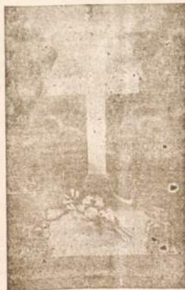
Bolševiknis nužudytų lietuvių vietas, taip dabar pagerbiamos pavergtoje Lietuvoje.

Katalikų spauda praneša, jog daugelis Lietuvos kunigų, gindamiesi nuo žudynių ir išvežimo į Aziją, buvo priversti prisidėti prie patriotinių paruošimų.