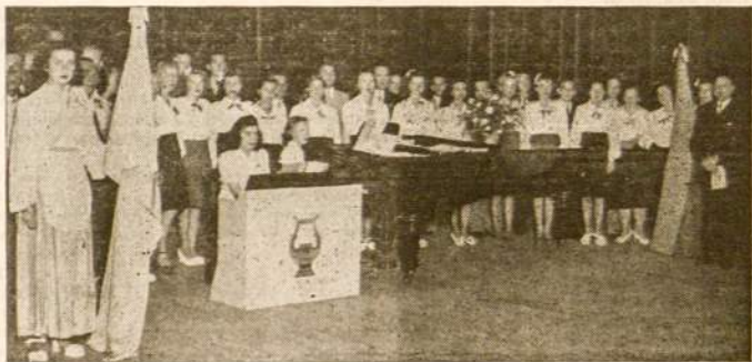
Buenos Aires Lietuvių, Šv. Cecilijos Vardo Choras

Buenos Aires, arba nuolatinėje savo buvainėje p. Ministras, Vasario 16-ją minint pasakė einamuoju momentu svarbią kalbą, kurią plačiai komentavo žymesnioji Pietų Amerikos spauda, o visų šio kontinento respublikų vyriausybės, kurios nepripažįsta Sovietų Rusijos smurto, p. Ministrą sveikino telegramomis, reikšdamos viltį, kad Lietuva nusikratys kruvinos maskolių okupacijos ir vėl sugrįš į laisvųjų tautų šeimą.