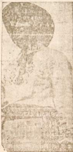
Jaunas lietuvis tautiškuose rūbuose, linksmame šventadienio pasivaikščiojime.

Viršpaminėtus asmenis per Lietuvos Pasiuntinybę paieško jų gimines, kurie randasi įvairiose Europos dalyse. Dėl smulkesnių žinių prašoma kreiptis į Pasiuntinybės raštinę, c. P. m. p. 4174, Buenos Aires nuo 10 iki 15 val., išskyrus šventadienius.