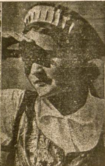
Gegužės Mėnuo Lietuvoje

Juk tu dar pameni, Kai vyšnios snigo sode. Kai baltus konfeti ant mūsų barstė!