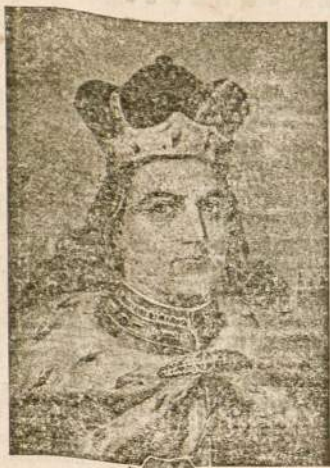
DID. LIETUVOS VYTAUTAS VIESPATAVO