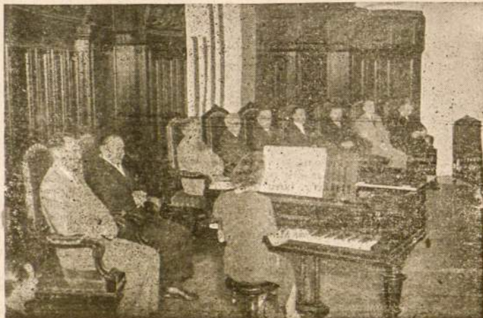
Lietuvos Gedulo Dienos Minėjimo Urugvajuje Prezidiumas Ir Oratoriai.