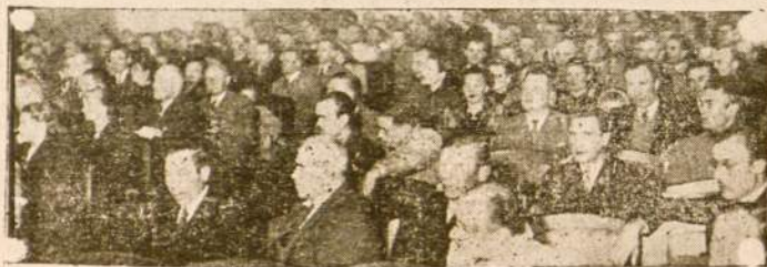
Lietuvos Gedulo Dienos Minėjimo Dalyvių Dalis

Minėjimas įvyko sekmadienį, birželio mėn. 16 d. 1946 m. — Atenco de Montevideo — patalpose ir buvo ypatingai pasekmingas.