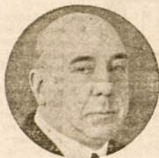
Jo Ekscelencija Urugvajaus Viceprezidentas Dr. Alberto Guani.