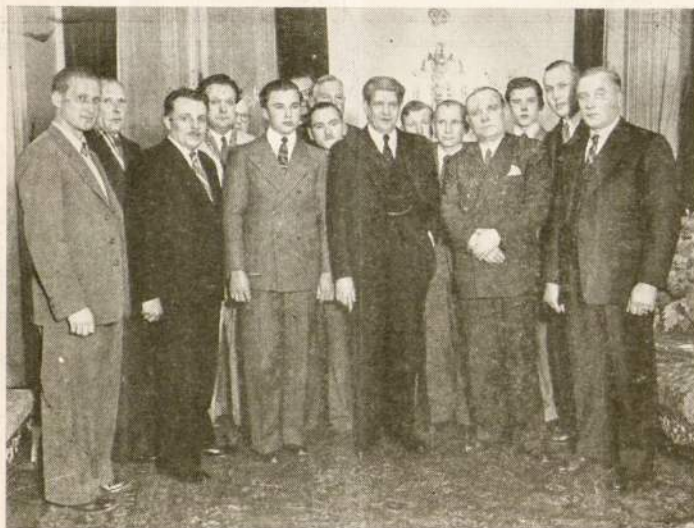
Urugvajaus Lietuviu Demokratinu Organizaciju Delegacija pas Respublikos Prezidenta Dr. JUAN JOSE AMEZAGA