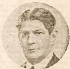
Jo Ekscelencija Urugvajaus Prezidentas Dr. Juan José Amézaga.