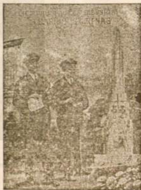
Steponas Darius ir Stasys Girėnas

Kiekvienais metais, visą pasaulio padorūs lietuvių liepos 17 d. iškilmingai atžymi kaip — Išeivių Dieną, — nes tą dieną tragingai žuvo Volentijos Solcino girtoje didieji Išeiviai, Lietuvos garbei, prastu lėktuvu perskridę Atlanto Vandenyne, mūsų tautos didvyriai, lakūnai kapitėnas Steponas Darius ir leitenantas Stasys Girėnas.