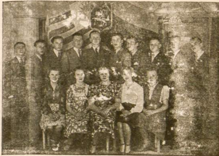
Urugvajaus Patriotinio Lietuviu Jaunimo Draugijos «Vytis» Vadovybė.