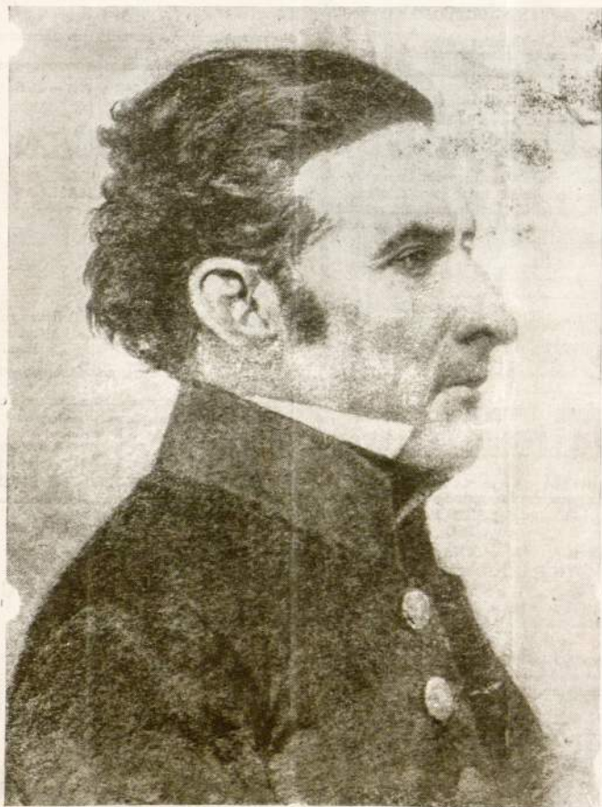
Gral. JOSE GERVAICIO ARTIGAS Libertador del Uruguay