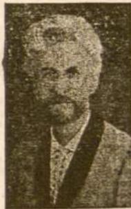
V y d ū n a s

Didysis Lietuvos rasytojas, gilus mintytojas ir dvasinės mūsų kultūros reišėjas, kuris pergyvenes karo siaubus laimingai pasitraukė nuo masholiu kruvino teroro ir dabar gyvena Volietijos Pomeranijoje. Ili 1945 metu jis gyveno ir rasė Mazosios Lietuvos sostinėje Tilžeje. Nežiūrint, kad Vydūnas jau turi 79 metus amziaus, bet jis yra dar gana stipras, energingas ir raso stambius bei naujus veikalus. Kiekvienam lietuviui patriotui tai dziugi zinia, nes Vydūnas dar daug patarnaus mūsų kovoję uz laisve.